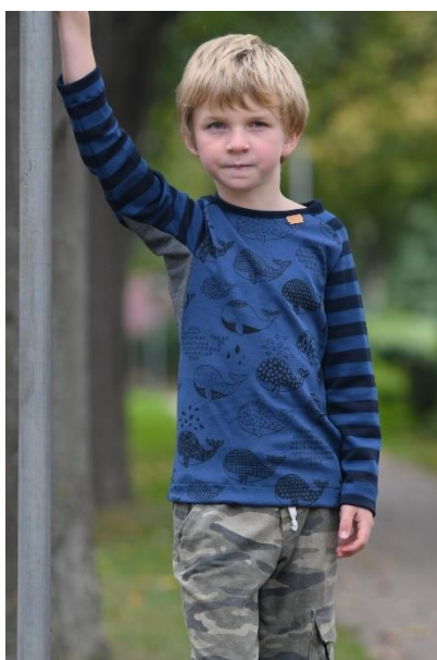
Mit eingefasstem Ausschnitt