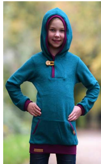
Longhoodie aus elastischem Frottee