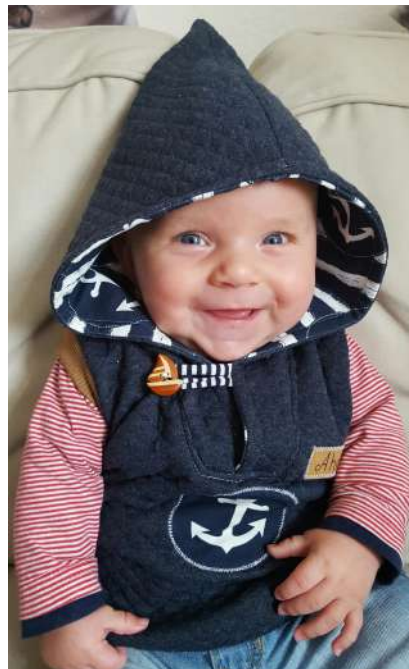
Westover aus Stepper