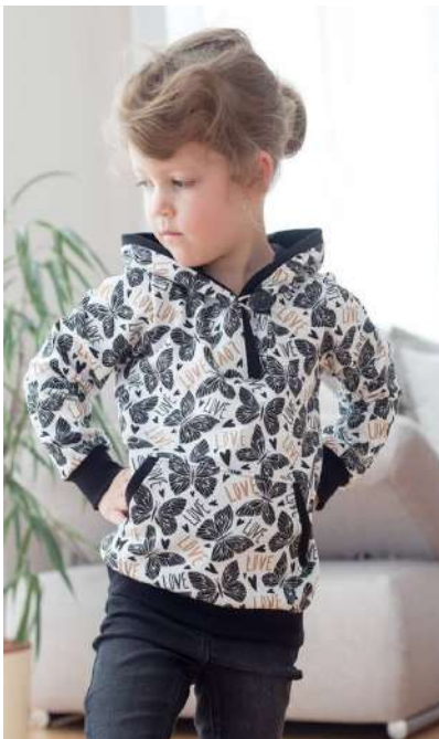
Hoodie aus Sweat