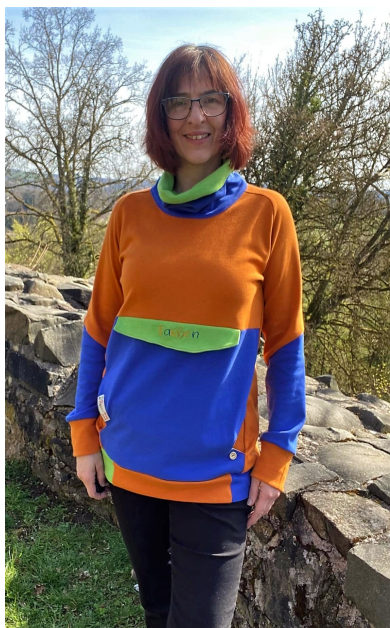
Kimi aus Sweat mit Teilung im Ärmel und Kragen