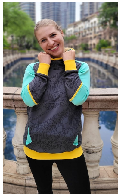
Kimi mit Kapuze und durchgehendem VT

Im Colorblockingstil sieht der Hoodie besonders schön aus: