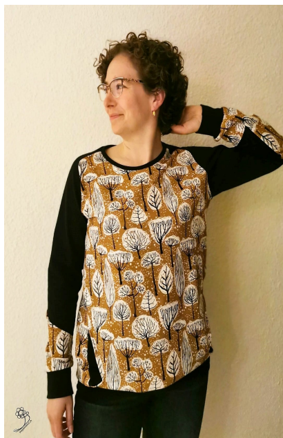
Kimi mit Bündchen und durchgehendem Vorderteil