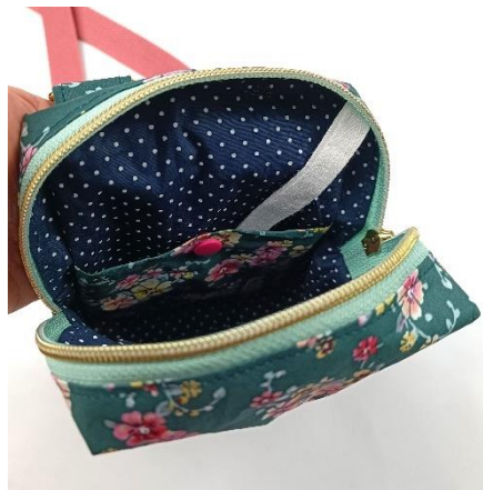
Steckfach in der Innentasche