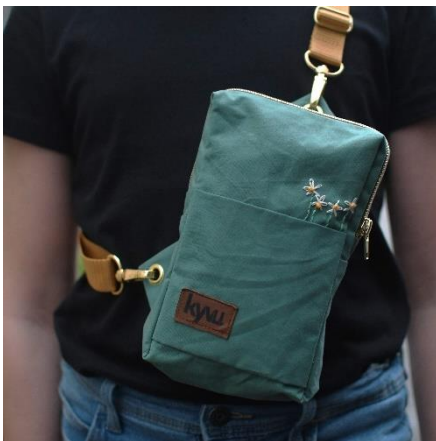
Steckfach auf dem Vorderteil