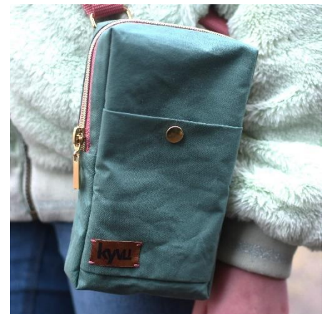
Steckfach mit Druckknopf