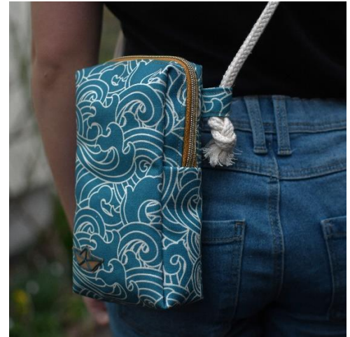
Crossbodytasche mit Tau

Diese Tragevariante liegt voll im Trend. Alles ist griffbereit und sieht zudem noch stylish aus.