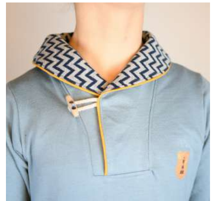
Küstenkind mit Paspel statt Bündchen im Kragen