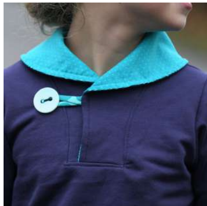
Pullover aus Sweat ohne Paspel oder Bündchen mit Cord als Futter