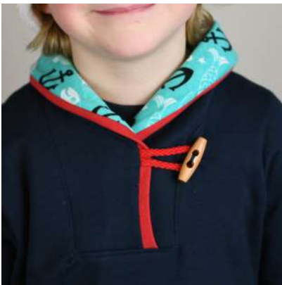
Küstenkind aus Sweat mit Bündchen im Kragen.