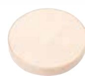
カップ 07 容器