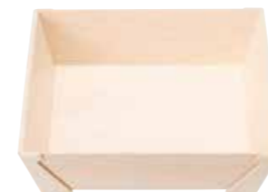
正方形 S 容器