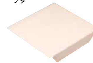
正方形 XL 木蓋