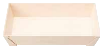
長方形 M 容器