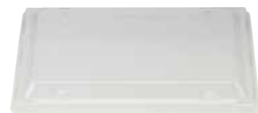
長方形 M プラ蓋