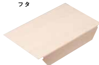
長方形 M 木蓋