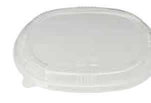
楢円 M プラ蓋