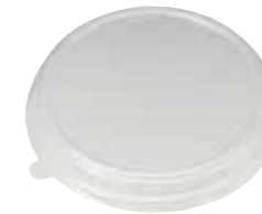
ボウル M 容器