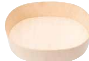
楢円 M 容器