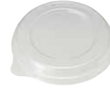
円形 S 容器