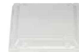
正方形 S プラ蓋