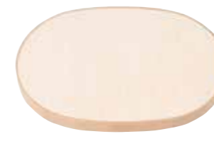
楢円 M 木蓋