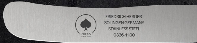
BUCKELMESSER GLATTSCHLIFF ART. 0336.110