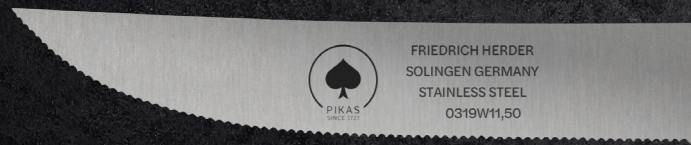
STEAKMESSER WELLENSCHLIFF ART. 0319.115.W

Auch individuelle Wünsche / Designs sind schon in kleiner Auflage möglich. Sprechen Sie uns gerne an.