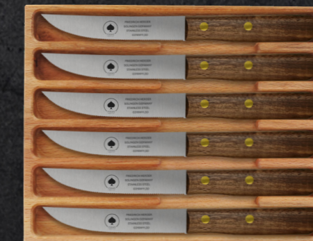
6ER SET ART. 0319.06 (Steakmesser) / 0336.06 (Buckelsmesser)