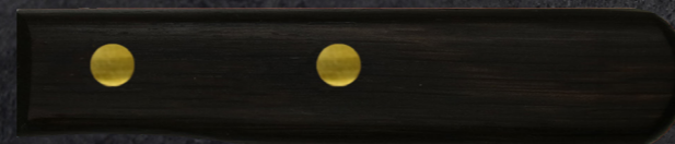
RÄUCHEREICHE AUS DEUTSCHLAND ART. BLOAK

Wählen Sie Ihre gewünschten Griffe. Alle Griffe werden in unserer hauseigenen Schreinerei natürlich aus nachhaltigem Holz gefertigt. Made in Solingen.