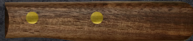
WALNUSS AUS DEN USA ART. WALNUT