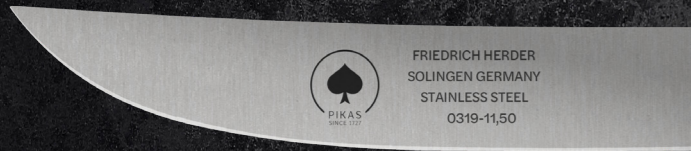
STEAKMESSER GLATTSCHLIFF ART. 0319.115