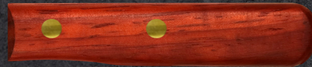
PADOUK AUS GABUN ART. PADOUK