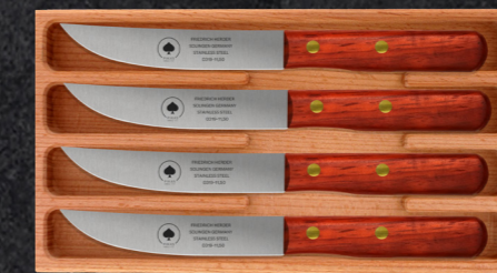
4ER SET ART. 0319.04 (Steakmesser) / 0336.04 (Buckelsmesser)

Die 4er und 6er Sets im hochwertigem Buche-Holzcase. Individuell von Ihnen bestückbar! Bestimmen Sie Klingeform und die Holzgriffe bei Ihrer Bestellung selbst.