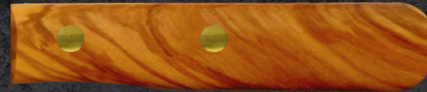
OLIVE AUS ITALIEN ART. OLIVE