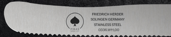
BUCKELMESSER WELLENSCHLIFF ART. 0336.110.W