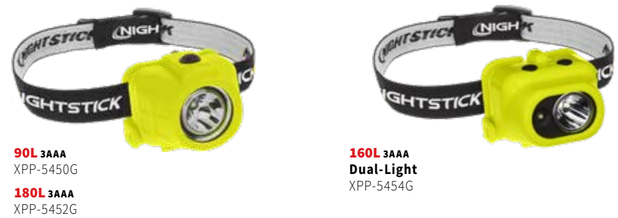
90L 3AAA XPP-5450G 180L 3AAA XPP-5452G