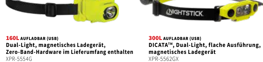
160L AUFLADBAR (USB) Dual-Light, magnetisches Ladegerät, Zero-Band-Hardware im Lieferumfang enthalten XPR-5554G