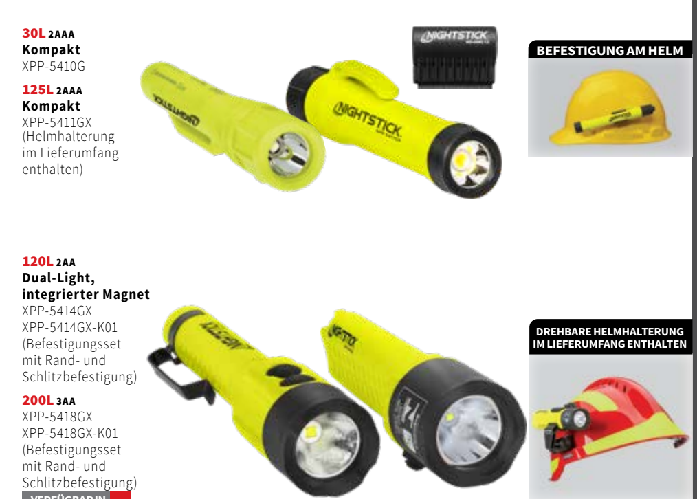
30L 2AAA Kompakt XPP-5410G