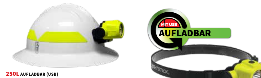
250L AUFLADBAR (USB) Dual-Light, Zero-Band-Hardware im Lieferumfang enthalten XPR-5553G