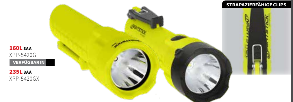
160L 3AA XPP-5420G VERFÜGBAR IN

GLEICHZEITIGER TASCHENLAMPEN- UND LASERBETRIEB