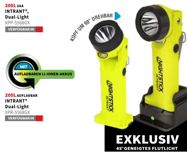
205L 3AA INTRANT™, Dual-Light XPP-5566GX VERFÜGBAR IN