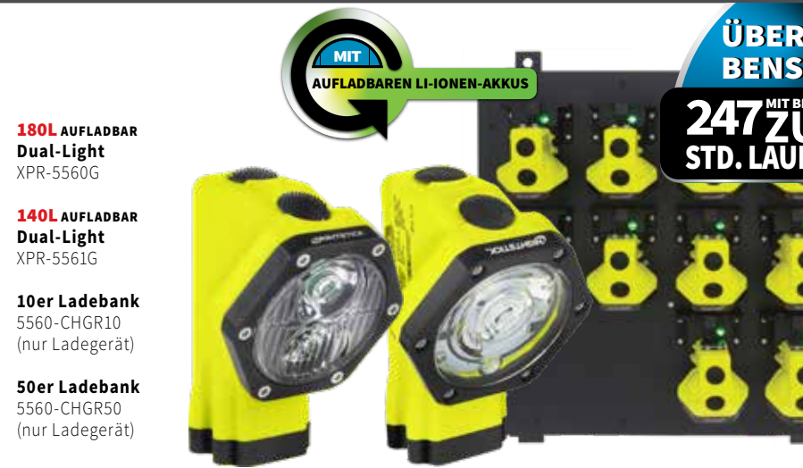
180L AUFLADBAR Dual-Light XPR-5560G