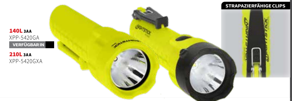
140L 3AA XPP-5420GA VERFÜGBAR IN