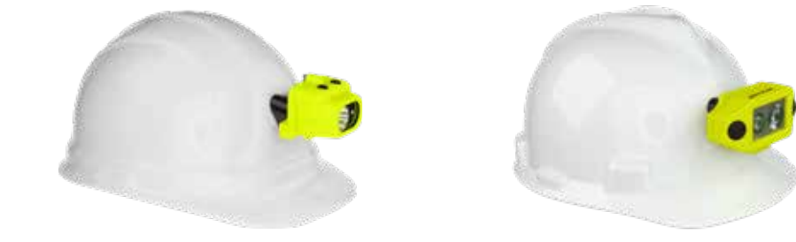
160L 3AAA Dual-Light, Zero-Band XPP-5454GC