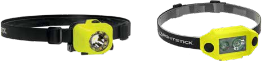
220L 3AAA Dual-Light, Zero-Band-Halterung im Lieferumfang enthalten XPP-5453G