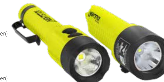
120L 2AA Dual-Light, ingebouwde magneet XPP-5414GX XPP-5414GX-K01 (bevestigingsset bevat rand- en sleufbevestigingen)