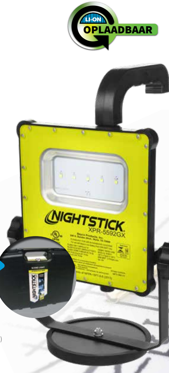
1200L OPLAADBAAR XPR-5592GCX (Lamp, koffer en statief)

SEYTMODELLEN OMVATTEN 1,8 METER HOOG STEVIG STATIEF STATIEF MET DUURZAME DRAAGTAS