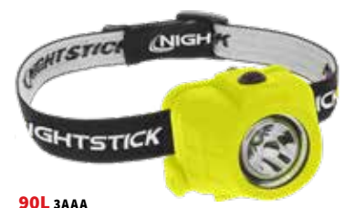
90L 3AAA XPP-5450G 180L 3AAA XPP-5452G