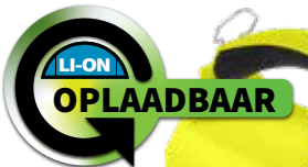
650L OPLAADBAAR Dual-Light XPR-5586GX