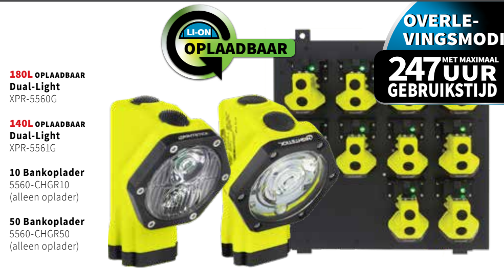
180L OPLAADBAAR Dual-Light XPR-5560G