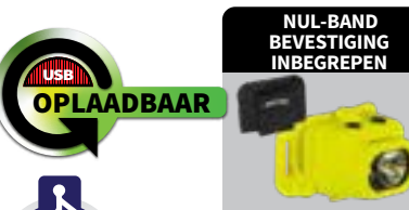
160L OPLAADBAAR (USB) Dual-Light, magnetische oplader, nul-band hardware inbegrepen XPR-5554G