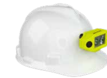
200L 3AAA Dual-Light, nul-band XPP-5460GCX