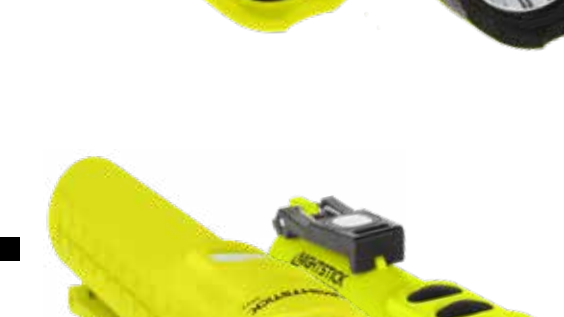
260L 3AA Dual-Light XPP-5422G BESCHIKBAAR IN

NEERWAARTSE SCHIJNWERPER EN INGEBOUWDE MAGNETEN