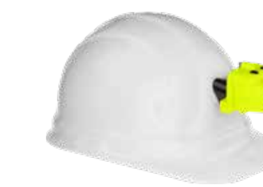
160L 3AAA Dual-Light, nul-band XPP-5454GC