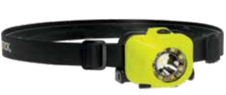
220L 3AAA Dual-Light, nul-band bevestiging inbegrepen XPP-5453G