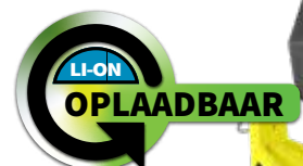
600L OPLAADBAAR INTEGRITAS™ 84 XPR-5584GMX (ingebouwde magneten)