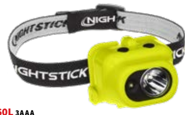
160L 3AAA Dual-Light XPP-5454G