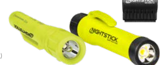
30L 2AAA Compact XPP-5410G