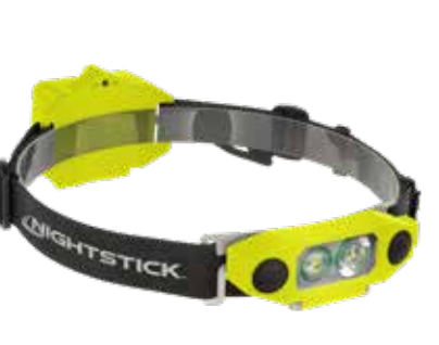
310L 3AA DICATA™, Dual-Light, laag profiel XPP-5462GX BESCHIKBAAR IN