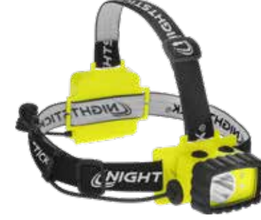
175L 3AA Dual-Light XPP-5456G (Rode schijnwerper) 190L XPP-5458G (Groene schijnwerper)