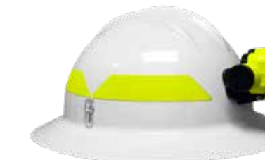
250L OPLAADBAAR (USB) Dual-Light, nul-band hardware inbegrepen XPR-5553G