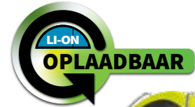
300L OPLAADBAAR VIRIBUS® 80 Dual-Light XPR-5580G BESCHIKBAAR IN