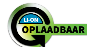
205L OPLAADBAAR INTRANT® Dual-Light XPR-5568GX BESCHIKBAAR IN