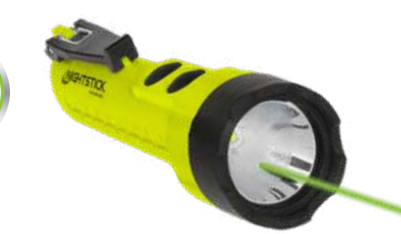
210L 3AA Licht met laser XPP-5422GXL