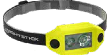
200L 3AAA Dual-Light, laag profiel XPP-5460GX