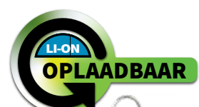
1750L OPLAADBAAR INTEGRITAS™ 82 XPR-5582GX XP R-5580G BESCHIKBAAR IN