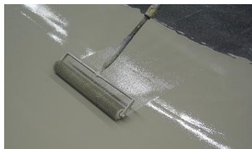
mit Stachelwalze überarbeiten