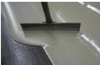
mit Stifterakel aufziehen