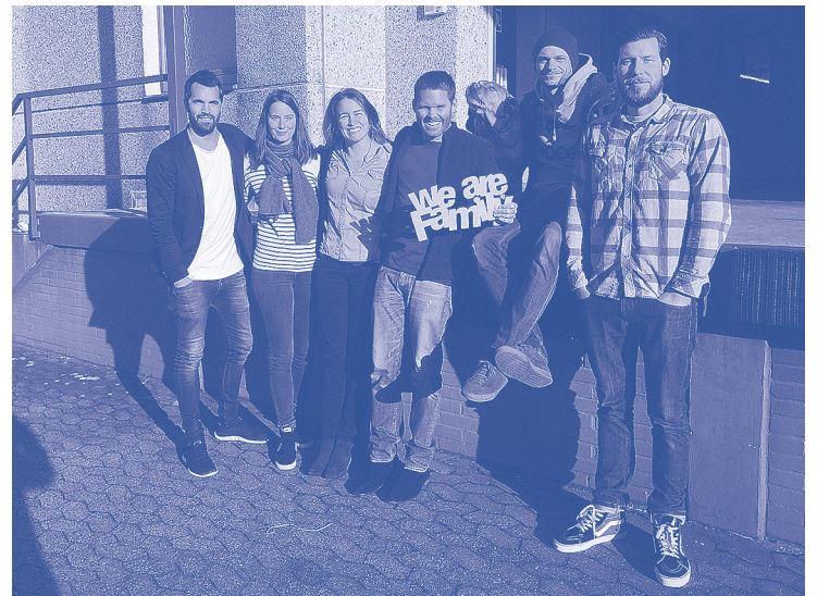
Dr. Bronner's team Germany

Unser europäisches Team hat die Partnerschaft zum Anlass genommen, Sea Shepherd bei einigen kleineren Gelegenheiten in ihren Kampagnen zu unterstützen.