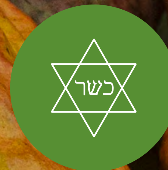
, ผ่านการรับรองโคเชอร์