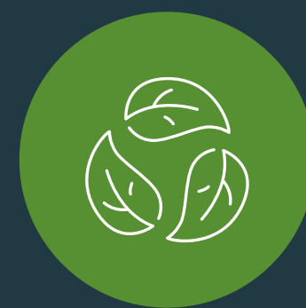
ผ่านการรับรองออร์แกนิก

ผลิตภัณฑ์คาเคาและช็อกโกแลตของเราได้รับการผลิตอย่างพิถีพิถันเป็นพิเศษที่โรงงานของเราและเหมาะสำหรับผู้บริโภคที่มีความต้องการทางโภชนาการที่แตกต่างกัน