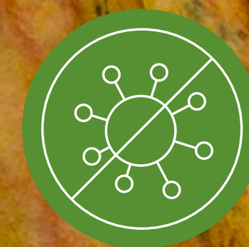
ปลอดสารก่อภูมิแพ้