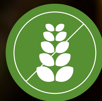
ปราศจากธัญพืช