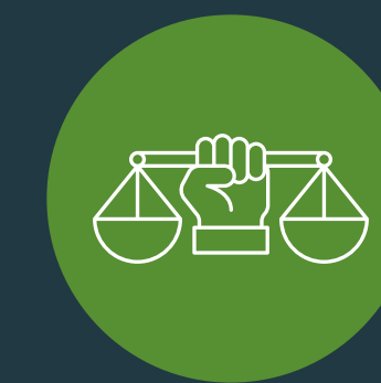
มีจริยธรรมและปราศจากสารทุจริต