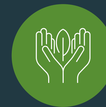
สร้างสิ่งแวดล้อมที่ยั่งยืน