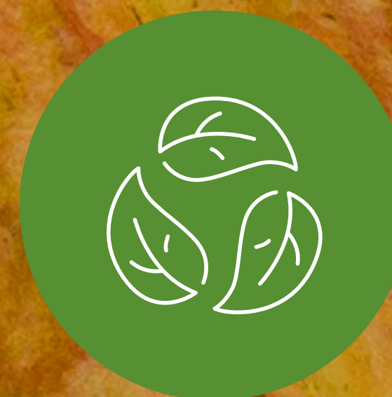
ผ่านการรับรองออร์แกนิก