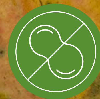
ปราศจากถั่ว