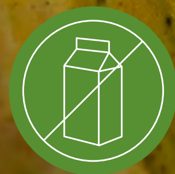
ปราศจากผลิตภัณฑ์จากนม