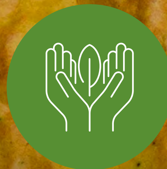
มังสวิรัต