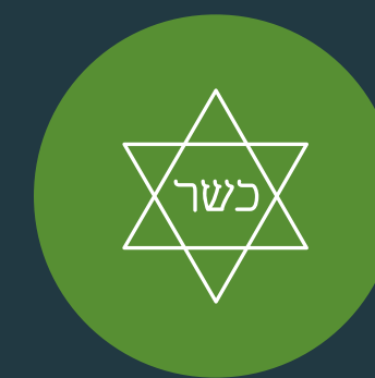
ผ่านการรับรองโคเชอร์