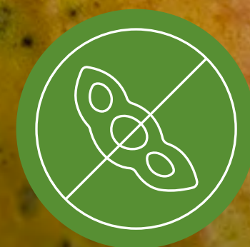
ปราศจากถั่วเหลือง