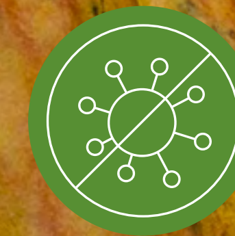
Libre de Alérgenos