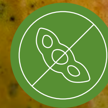
Libre de Soya