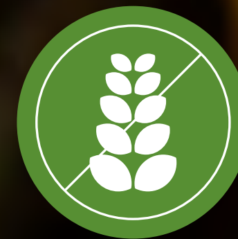
Libre de Trigo