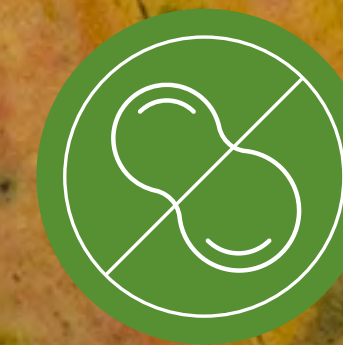
Libre de Nueces