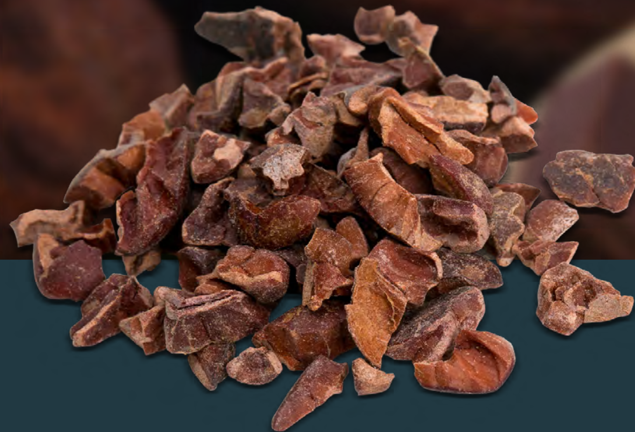
CRUDO / TOSTADO

Somos uno de los principales fabricantes y exportadores de Nibs de Cacao Orgánico en el Perú. Los nibs los obtenemos tostando los granos de cacao, quitando la cáscara exterior y luego rompiendo los granos en trozos pequeños.