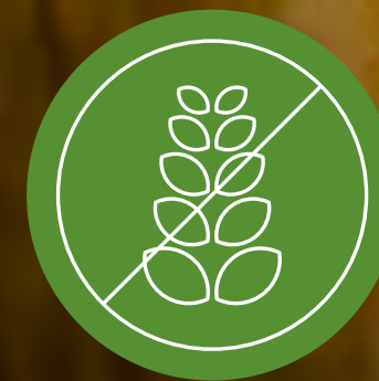
Libre de Gluten