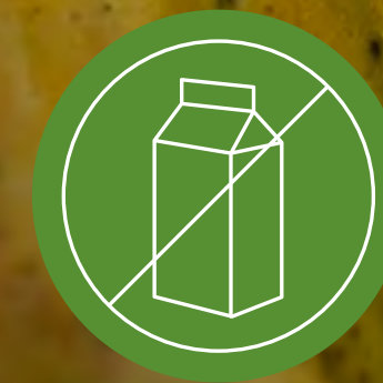
Libre de Lacteos