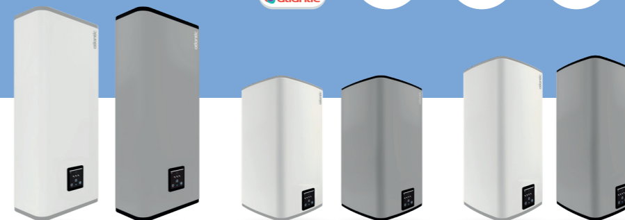
40 L - 65 L - 80 L