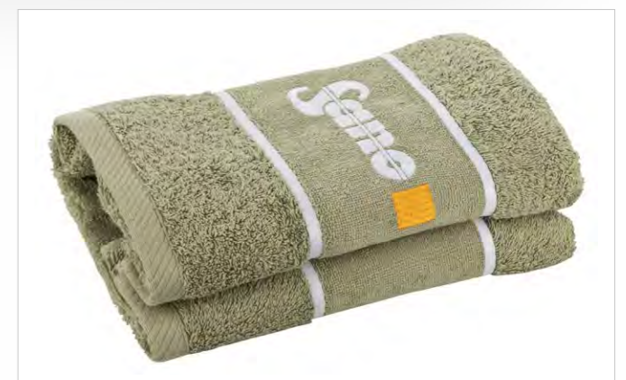
Bordüre mit Stick