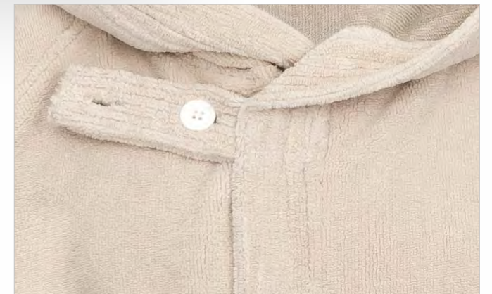
Sonderschnitt mit Knopfleiste