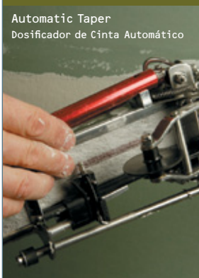
Automatic Taper Dosificador de Cinta Automático