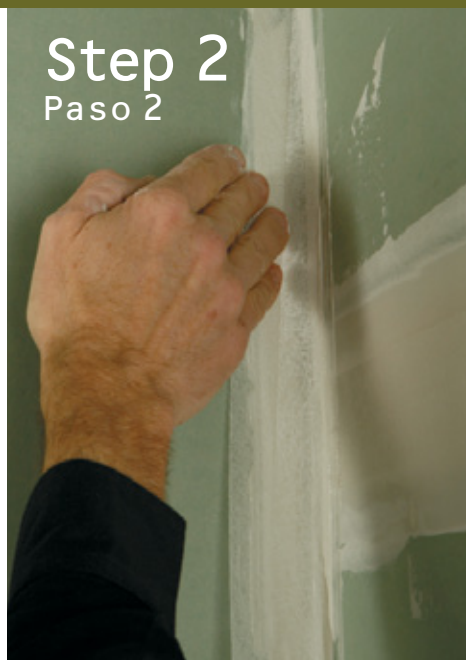
Step 2 Paso 2