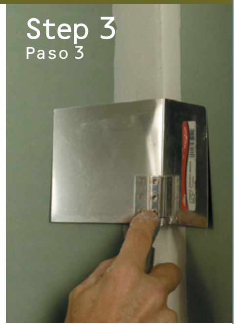
Step 3 Paso 3