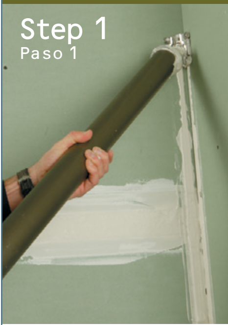
Step 1 Paso 1