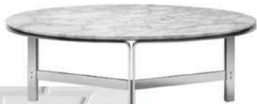
FLEXFORM A mesa de centro Clarke é assinada por Carlo Colombo e tem estrutura em metal. O tampo, com apoio em mármore e madeira, segue elegantemente o estilo contemporâneo com leveza.