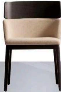
CAPDELL Assinada por Christiano Kohnholz Rhee, a poltrona Concord tem base em madeira fave e assento estofado, além de encosto que combina com o tom das pernas. A peça conta com diversos acabamentos e cores e se encaixa perfeitamente na atmosfera do dormitório.