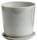
HAY DESIGN Três halóuzas, os vasos da linha BioCentral contam com linhas suaves em tamanhos diversos. Disponíveis em metal ou cerâmica e acabamento em alto brilho.