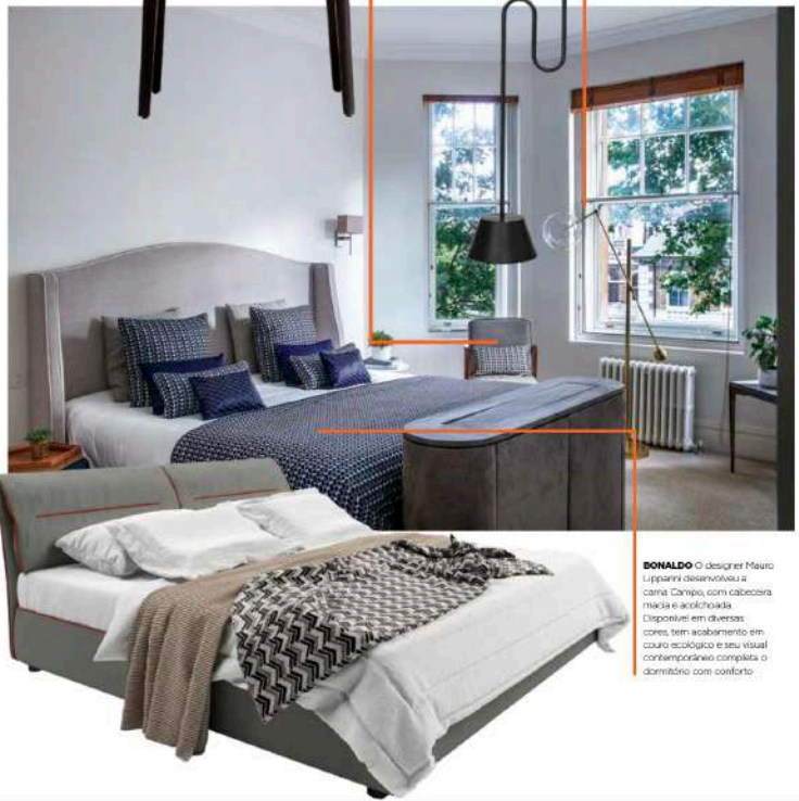
FAS Garantindo iluminação direcionada, a luminária de chabo Isaacso 1831 tem corpo em tubo de aço com formato semelhante a um "3", e acabamento laqueado preto. A cúpula trência cria contraste e coordena com tons do espaço.