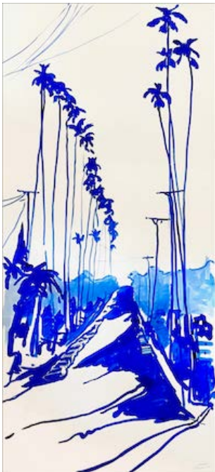
Hollywood now 14, 2022 150 x 65 cm Encre sur papier