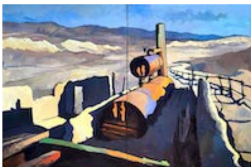
Le gardien de la lumière, Death Valley, 130 x 195 cm