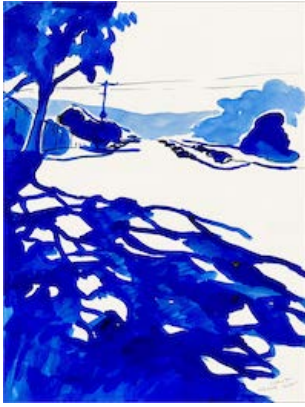
Hollywood now7 , 2022 65 x 50 cm Encre sur papier