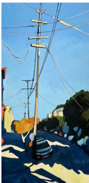
Le Couloir des miroirs, 2021 195 x 97 cm Huile sur toile