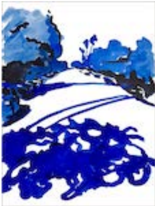
Jungle in the city 12 , 2022 50 x 37 cm Encre sur papier