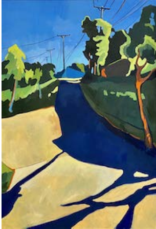
Quelqu'un dans mon genre, 2022 130 x 89 cm Huile sur toile