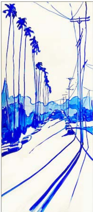
Hollywood now 16 , 2022 150 x 65 cm Encre sur papier