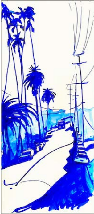
Hollywood now 15 , 2022 150 x 65 cm Encre sur papier