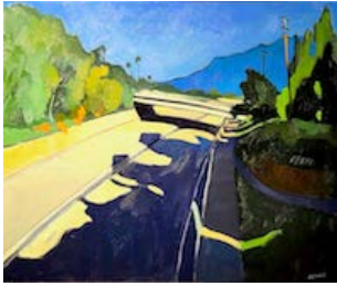
Los Angeles river, 65 x 80,5 cm Huile sur toile