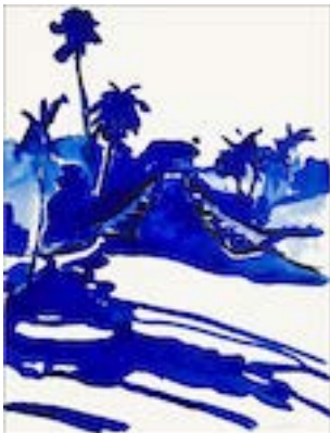
Jungle in the city 13 , 2022 50 x 37 cm Encre sur papier