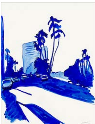
Hollywood now 1, 2022 65 x 50 cm Encre sur papier