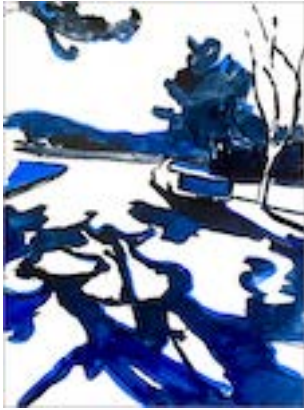
Jungle in the city 11 , 2022 50 x 37 cm Encre sur papier