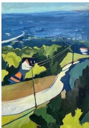
La Vallée des stars II, 2022 65 x 46 cm Huile sur toile