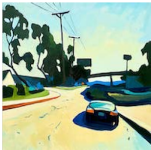
Des secrets plein la tête, 2022 60 x 60 cm Huile sur toile