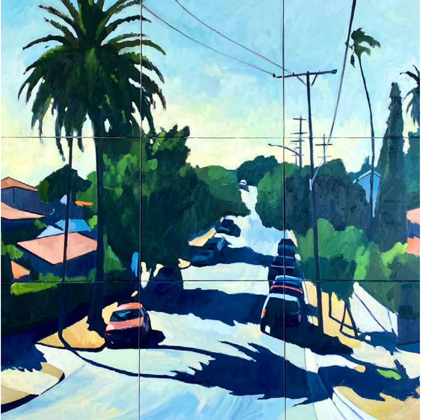
« Plein soleil » 180x180 cm