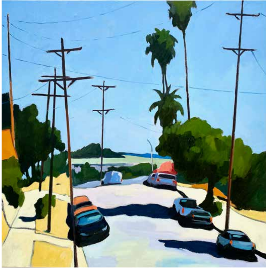
« Rosanna » 100×100cm