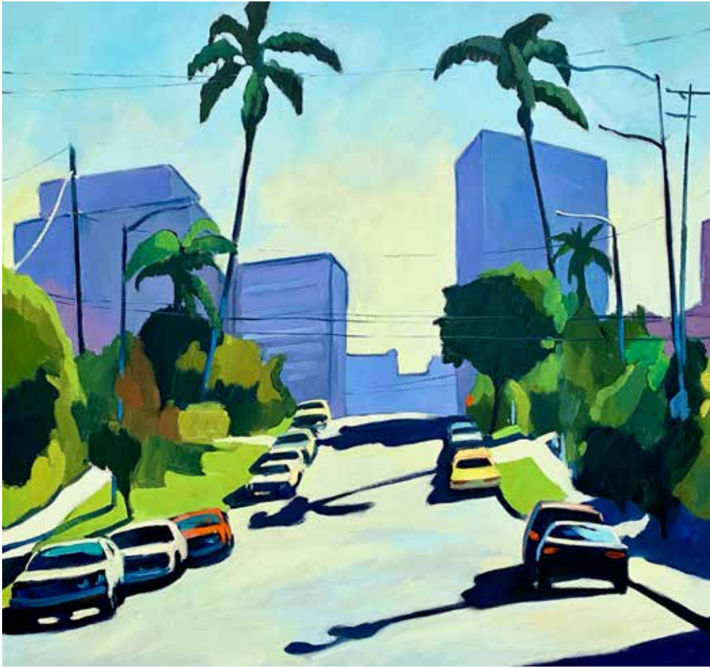
« This way » 100x100 cm