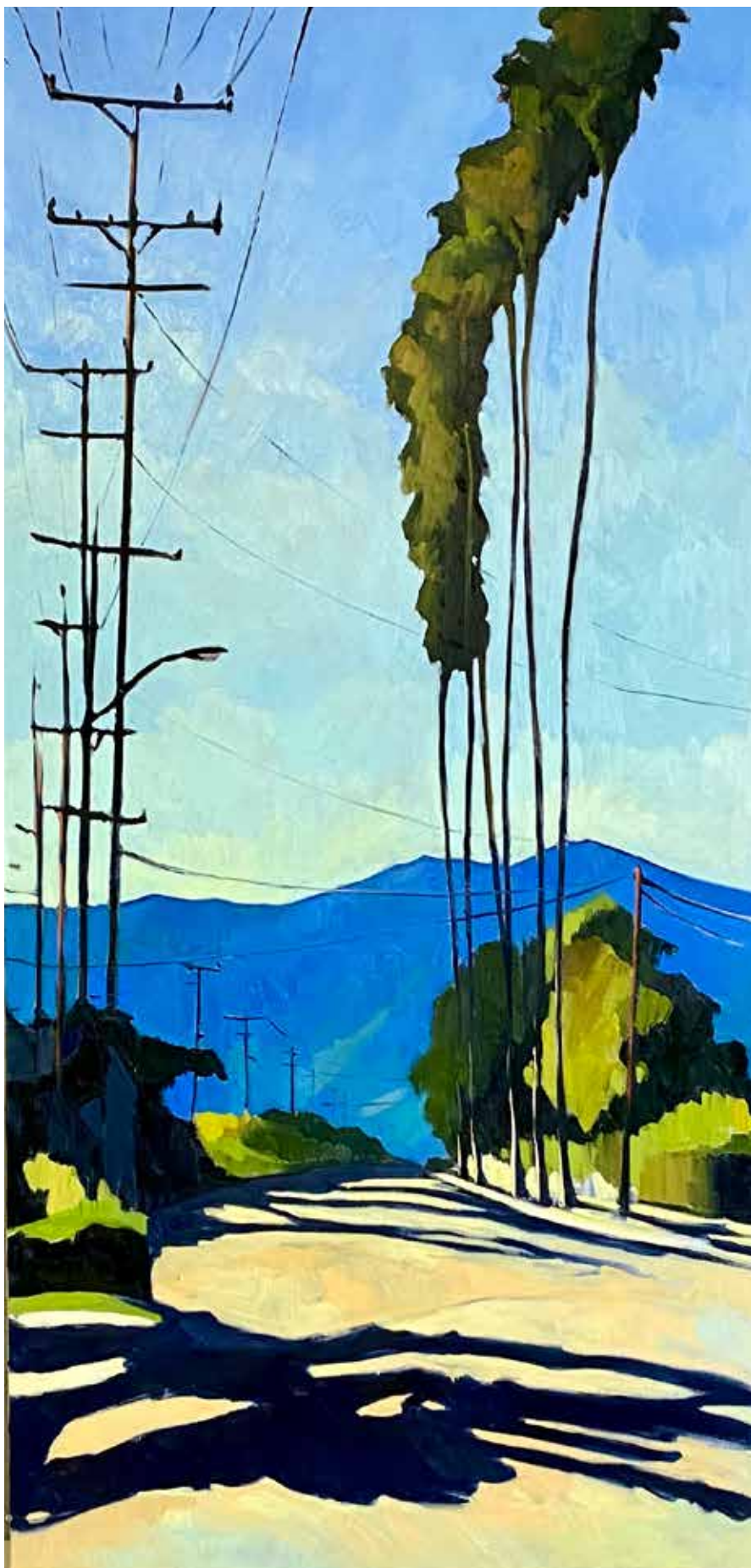
« Le sourire de John Wayne » 195x97 cm