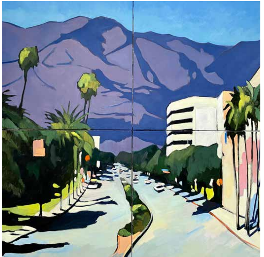
« Lady in waiting » 120×120 cm