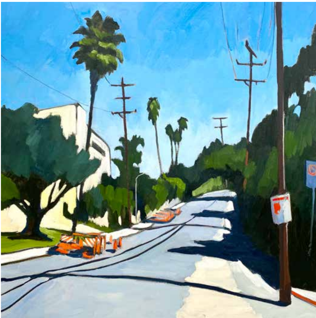
« Dead weight » 80x80 cm