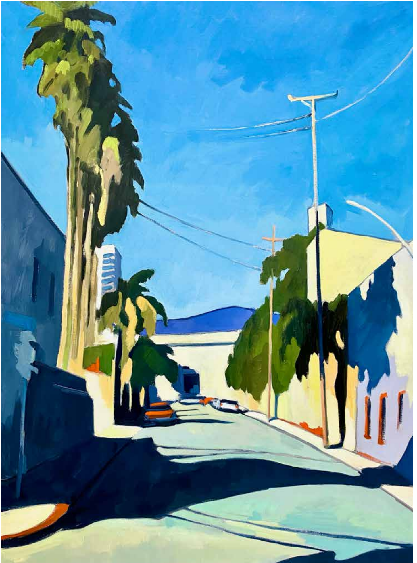
« Studio Hollywood » 130x97 cm