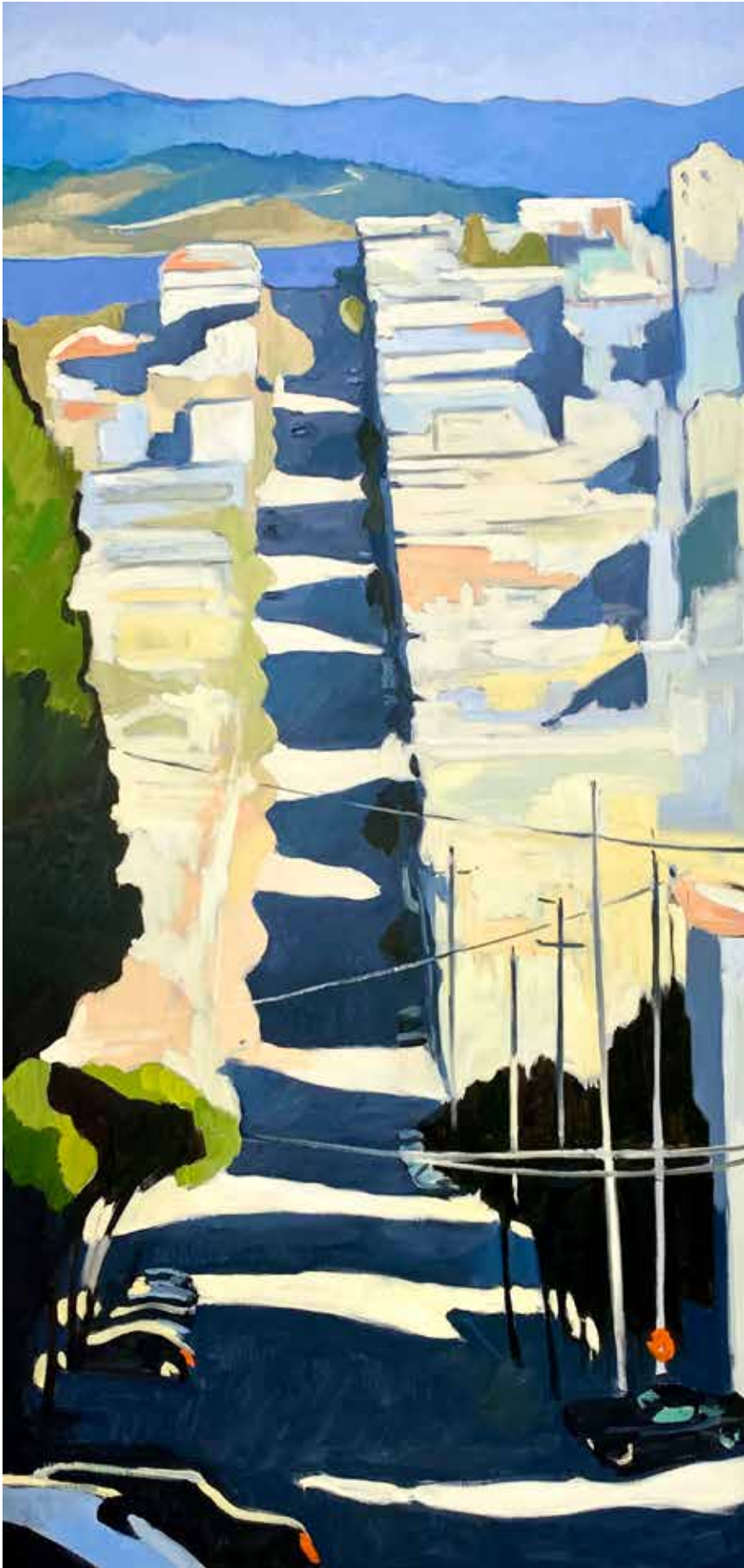
« One chance to live » 195x97 cm