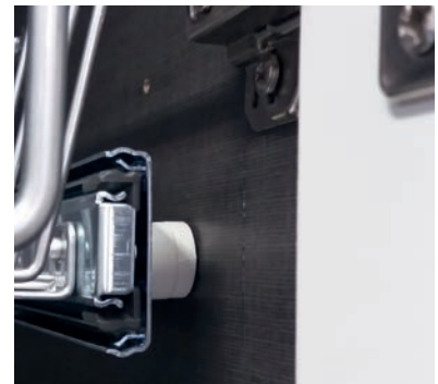
Montage mit Distanzhülsen für die Scharnierseite

↔ Bitte mind. 5 cm Abstand zur vorderen Schrankkante