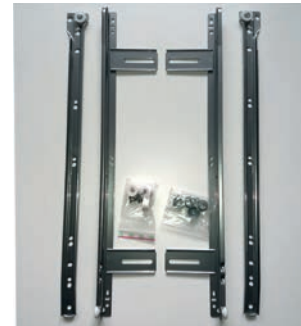
Zur Montage der Schienen legen Sie sich bitte die Einzelteile zurecht.

Wenn beide Schienen befestigt sind, können Sie nun den Korb in die vorhandenen Langlöcher der Schiene setzen. Jetzt wird der Korb mit den beiliegenden Rändelmutter und Unterlegscheiben befestigt. Drehen Sie diese zunächst nur leicht fest, damit Sie den Korb nach Ihren Wünschen ausrichten können. Danach drehen Sie die Rändelmuttern bitte fest an.