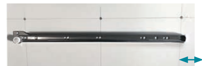
Bitte 6 cm Abstand halten zur Schrankkante