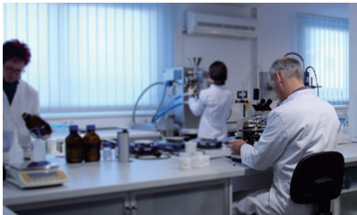
皮膚科学研究所(ドイツ)内での研究風景

健康で美しい肌は、水分、脂質(油)、常在菌、pH、肌呼吸など複雑で絡み合った様々な要素が時計仕掛けの歯車のように、適切なバランスを維持することで実現できます。そのための、〈バリア機能を維持〉し〈コラーゲン・エラスチン・ヒアルロン酸の減少を抑制し補う〉ことが、化粧品ができる美肌のためのスキンケアと考え、肌呼吸を阻害せず、pHや常在菌のバランスまでも考えたスキンケア製品で、毎日のケアを継続することが大切だと考えています。その理想を全て詰め込んだのがハウトシールドです。