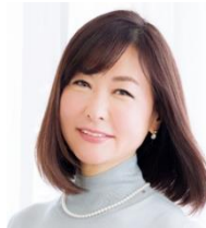
開発者 取材・執筆 美容ジャーナリスト 倉田 真由美

長きに渡り、あらゆる化粧品を見てきた、と思っていた私ですが、「なるほど、こういう考え方があったんだ」と感心させられたのが、ハウトシールドです。実のところ、美肌で有名な元アナウンサーのタレントやモデル、皮膚科医、敏感肌の人たちの間では、すでに愛用中の人がいるそう。私が勉強不足ただけで、知る人ぞ知る名品だったようです。かくいう私の肌も季節の変わり目や体調によって肌が揺らぎやすい敏感タイプ。その分、使う化粧品によって肌の質まで変わるといってもいいくらいの“目利き”ならぬ“肌利き”ができます。「これはよさそう」と直感したものの、元来が疑り深い性分ゆえ、「本当かなあ?」というかすかな疑いを持ちつつも…使ってみたのでした。