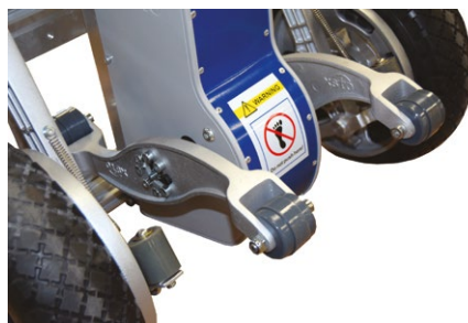
Equipé d'un frein de sécurité