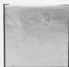
Housse d'hivernage isotherme