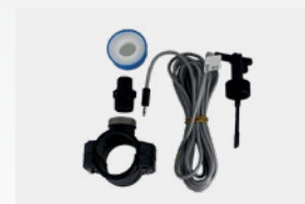
Kit détecteur de débit