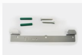
Kit fixation murale