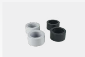
Kit réducteurs à coller