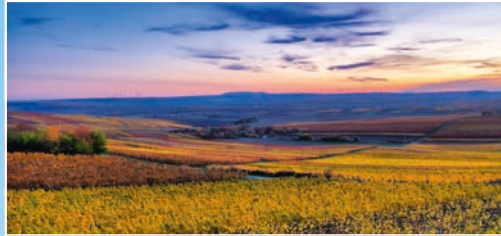
Entschleunigung: Erholsame Auszeit on tour