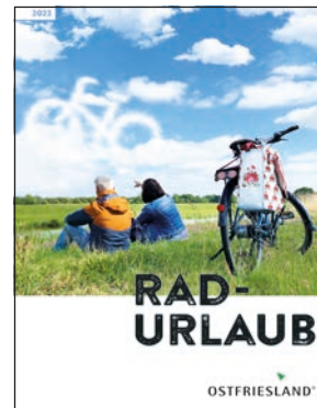
Abb.: Ostfriesland Tourismus GmbH

Ostfriesland – dort, wo der Himmel den Horizont berührt und der Wind die salzige Luft mitbringt, kann man durchatmen, die Ruhe genießen und den Alltag vergessen. Wer hier mit dem Rad unterwegs ist, genießt romantische Sielhäfen und das Wattenmeer, Kanäle und Flüsse, zahlreiche alte Backsteinkirchen, Mühlen, Schlösser und Burgen sowie die großzügig angelegten Parkanlagen und liebevoll gepflegten Privatgärten am Wegesrand. Dies alles bieten fünf Ostfriesland Rad-Routen, die zum Etappenradeln oder zu Sternfahrten einladen. Prächtige Windmühlen, weiße Klappbrücken und Fehnhäuser begleiten entlang der »Deutschen Fehnroute«. Die »Internationale Dollard Route« führt über die Grenzen Ostfrieslands hinaus in die Niederlande. Krönung der Tour ist ein Besuch der Insel Borkum im Weltnaturerbe Wattenmeer. Ostfriesland von oben genießen geht auf der