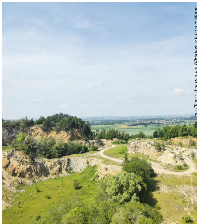
Abb.: epr/Tourist-Information Nördlingen/Johannes Häfner

* PADMA GaLeTib und HepaTib sind Nahrungsergänzungsmittel.