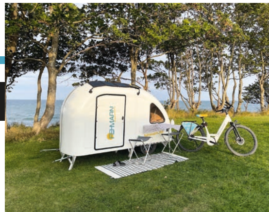
Abb.: Tourismus-Service Fehmarn