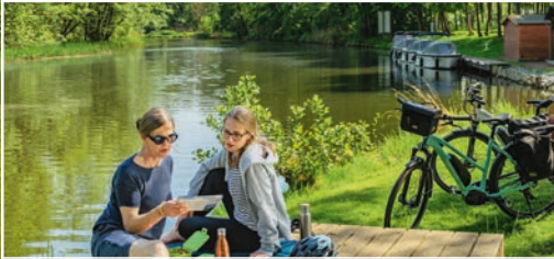
Versteckte Schätze und unvergessliche Momente