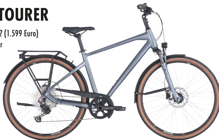
Abb.: Rückenwind Reisen

auf Tour und für den Alltag. Die hochwertigen Komponenten: ein leichter Aluminium-Rahmen mit integrierter Kabelführung, eine Shimano Deore 12-Gang-Schaltung mit großzügig abgestufter Kassette und Hyperglide+ Technologie für bessere Schaltvorgänge, Schwalbe G-One Allround Bereifung, ein komfortabler Comodoro Sattel sowie ein heller LED-Scheinwerfer mit Sensor und Standlichtfunktion. Infos: ☞ pegasus-bikes.de