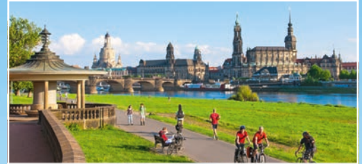
Land und Leute kennenlernen