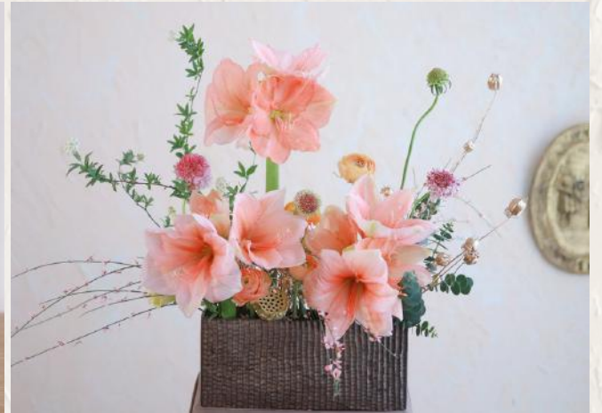
FA2009 長型前台花 - 花泥應用 $1780 9/5 (Mon) 10:00-13:00