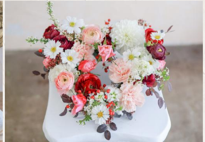
FA0009 立體心型花環 - 花泥應用