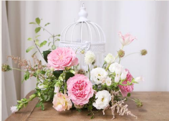
FA2008 鳥籠花 - 花泥應用 $1480 5/4 (Tue) 14:30-17:30