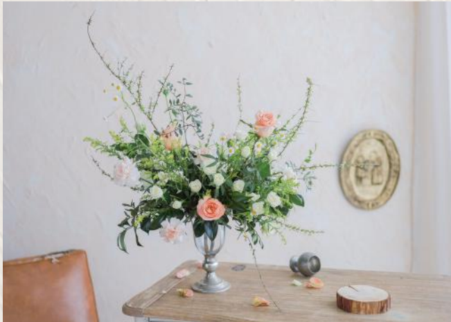
FA2007 復古檯花 - 花泥應用 $1780 13/6 (Mon) 18:30-21:30