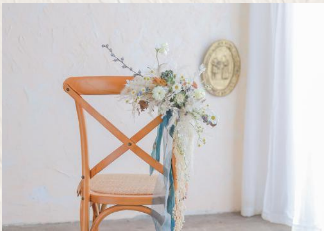
FA0004 椅背花 - 無花泥技巧