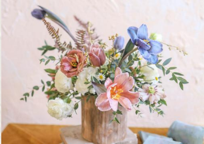
FA1001 基礎歐式檯花 - 花泥應用