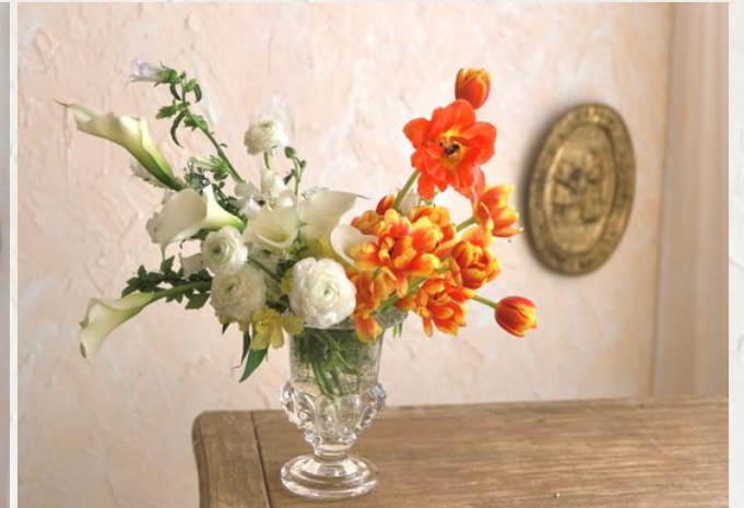
FA2003 中型花翁 - 無花泥技巧