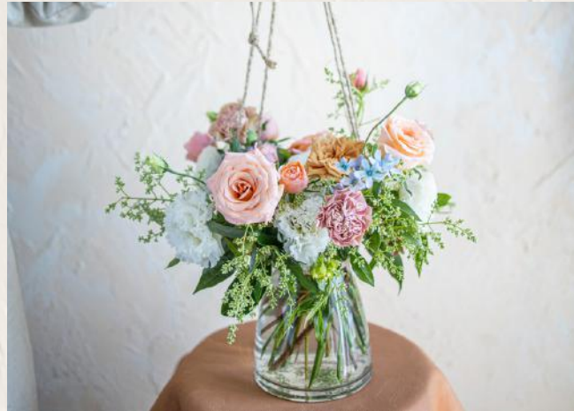
FA0002 日常家居瓶花 - 螺旋技巧