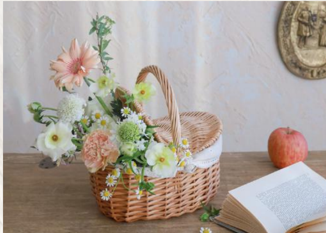
FA0008 鮮花野餐籃 - 花泥應用