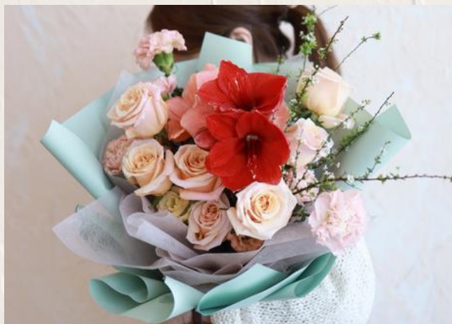
GB2002 特別花材中型花束II - 空莖花材 $1780