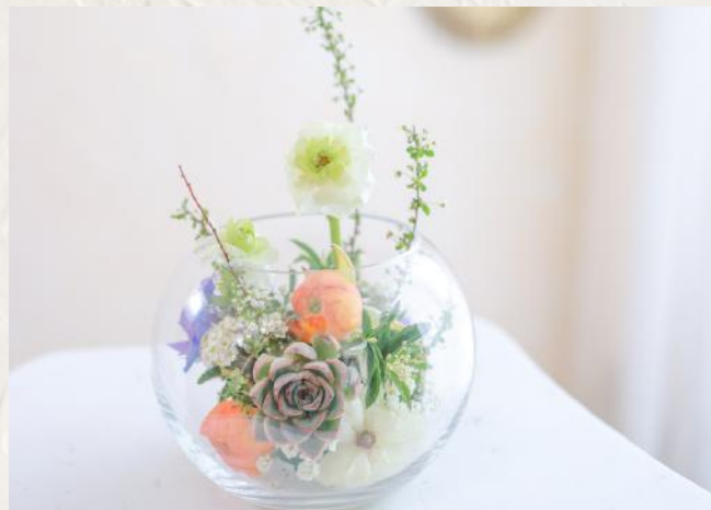
FA0005 魚缸花 - 花泥應用