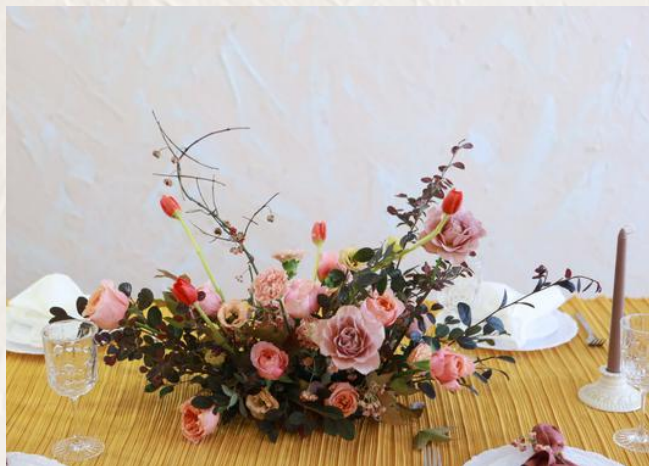
FA2011 長餐桌花I - 花泥應用 $2000 本季不適用，此課將於下季開課