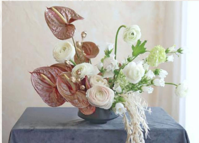
FA2005 非對稱式花砵 - 劍山應用