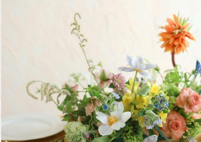
FA3001 長餐桌花II - 無花泥技巧