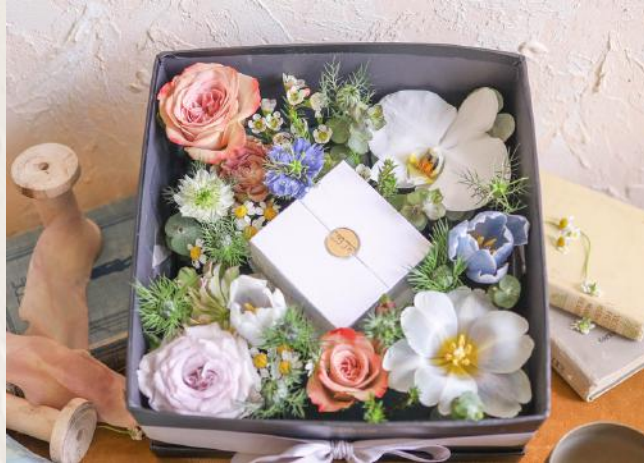
FA1002 商業花盒I - 花泥應用