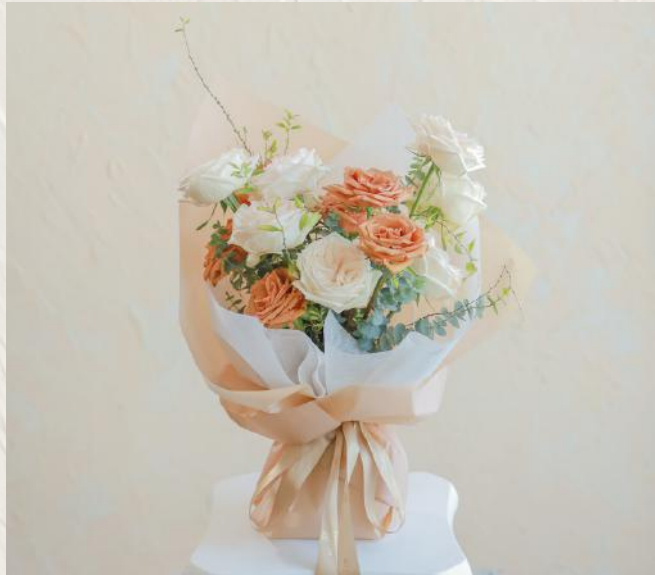
GB0001 玫瑰層次感花束I $1080 5/4 (Tue) 10:00-13:00 28/5 (Sat) 10:00-13:00