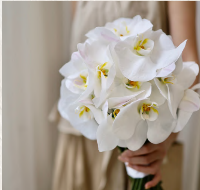
B03002 白蝴蝶蘭圓型花球