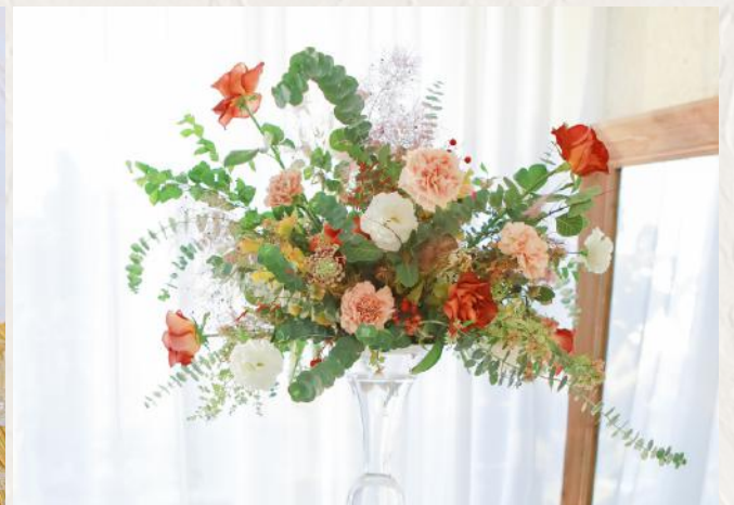
FA2012 長餐桌高桌花 - 花泥應用 $2000 19/6 (Sun) 10:00-13:00