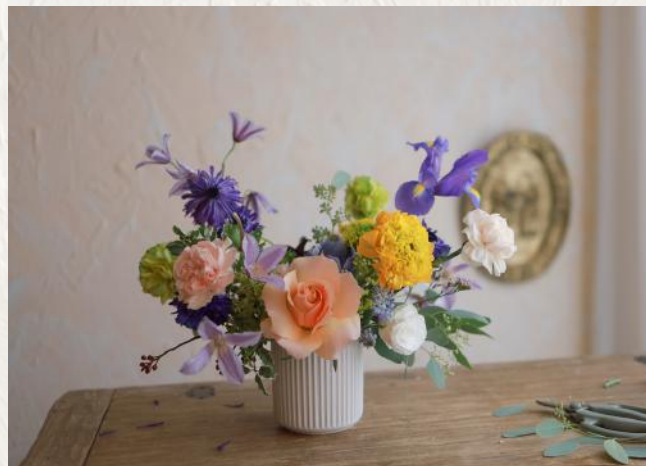
FA3005 歐式桌花 - 劍山應用