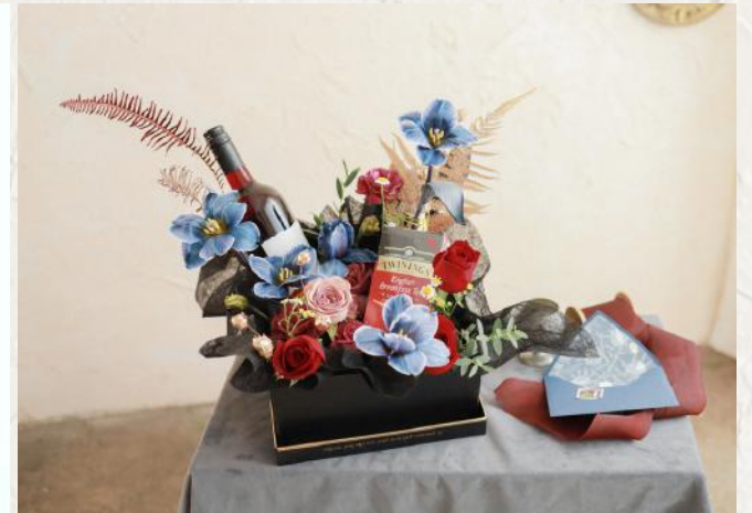
FA2006 商業花盒II - 花泥應用