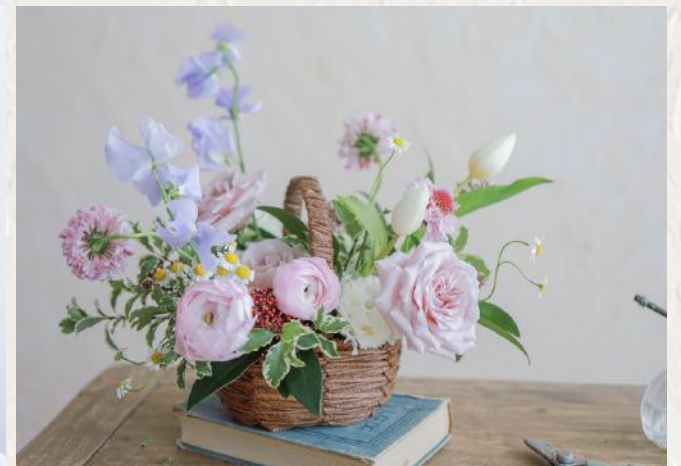
FA0006 自然風花籃 - 花泥應用