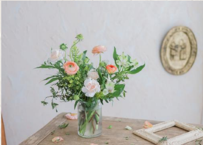
FA0001 日常家居瓶花 - 非螺旋技巧