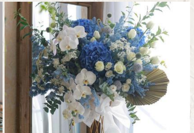
FA3006 開張花籃 - 花泥應用