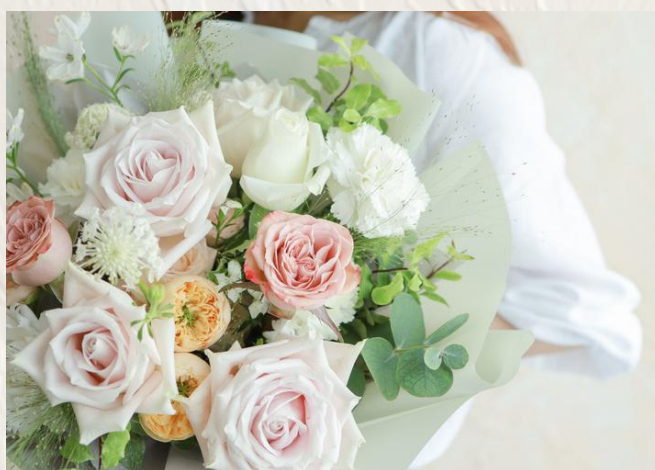
GB2004 360度花束II $1780