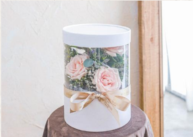
FA0007 韓式圓型花盒 - 花泥應用