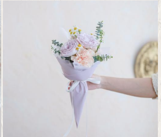
GB0003 雪糕筒小花束 $880 23/5 (Mon) 14:00-16:30