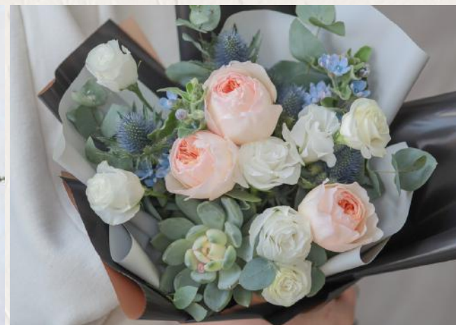
GB2003 特別花材中型花束III - 多肉植物 $1580