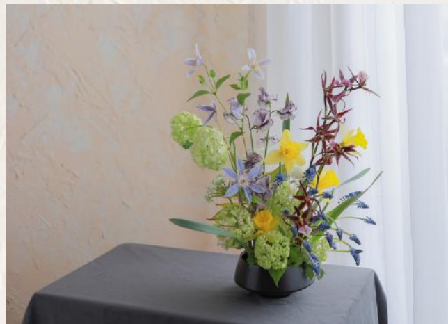
FA1005 植生式花砵 - 劍山應用