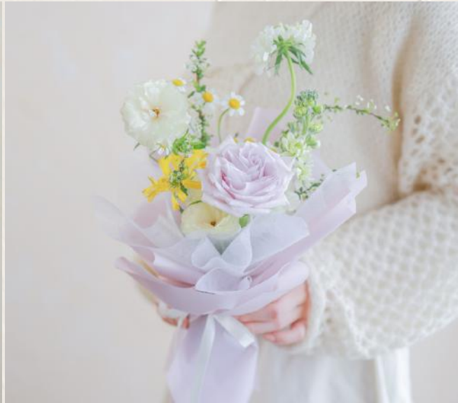
GB0002 自然風小花束 $880 5/4 (Tue) 14:30-17:00 4/6 (Sat) 10:00-12:30