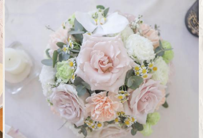
FA1003 圓桌經典桌花 - 花泥應用