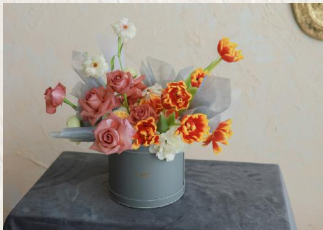
FA1004 鮮花抱抱桶I - 花泥應用