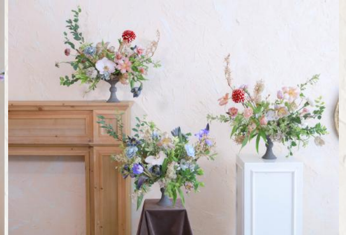
FA3003 鮮花染色學及歐式桌花 - 花泥應用