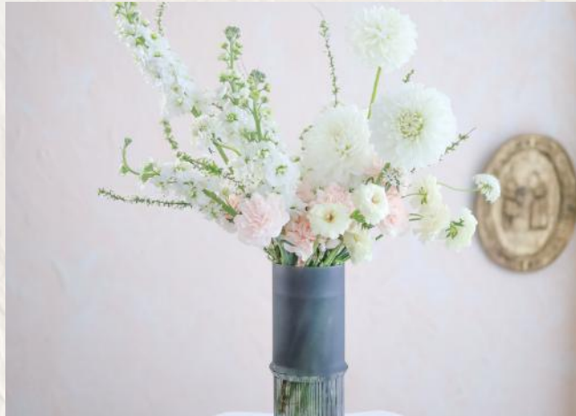
FA2002 高花瓶插花 - 螺旋技巧