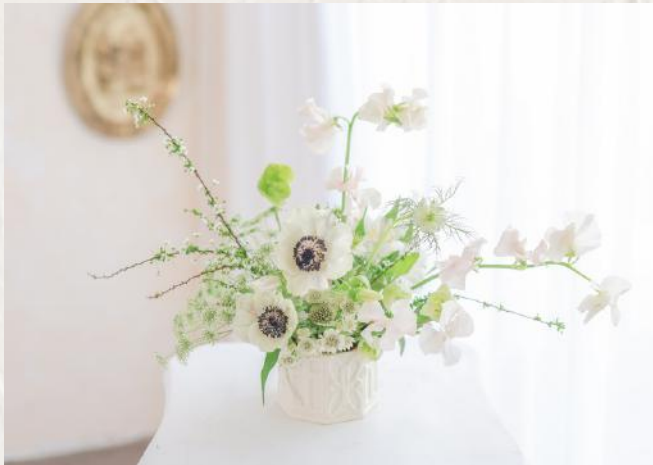
FA2004 中型桌花 - 劍山應用