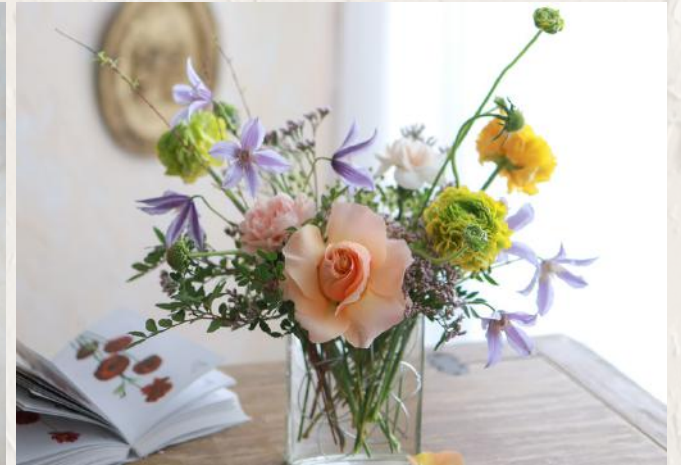
FA0003 扁身花瓶 - 非螺旋技巧