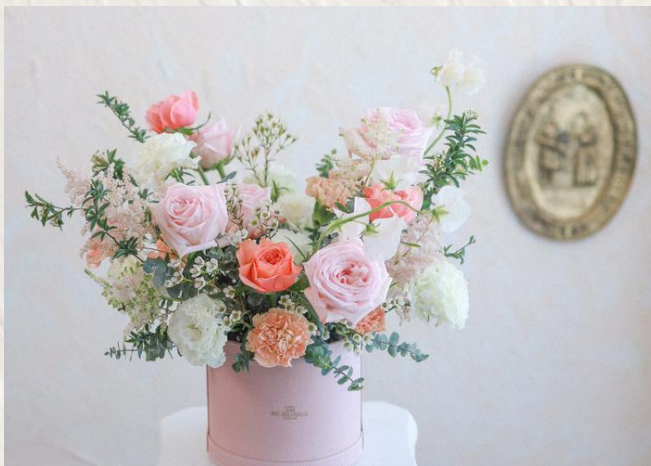
FA2010 鮮花抱抱桶II - 花泥應用 $1980 19/6 (Sun) 14:30-17:30