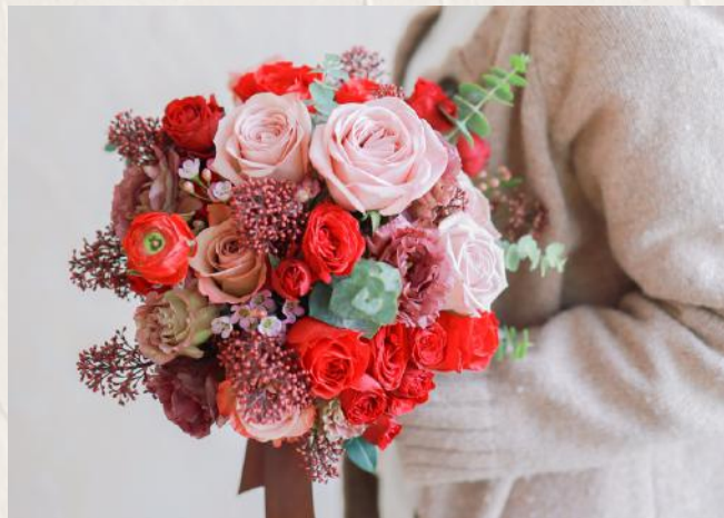
B01001 輕層次感圓型花球