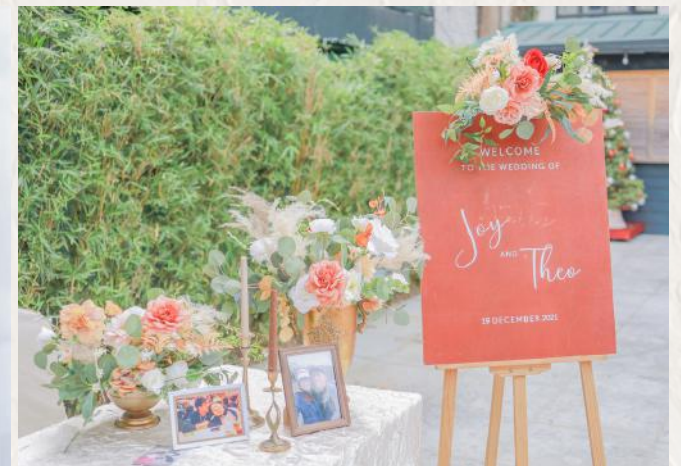
FA1006 婚禮佈置: 迎賓區佈置 - 花泥應用