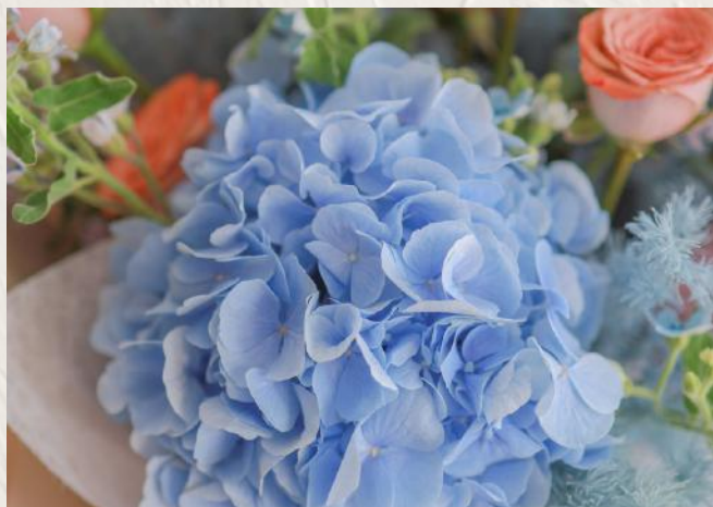
GB2001 特別花材中型花束I - 巨形花材 $1780