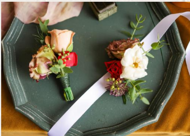
FA0010 襟花 + 手花 - 鐵線應用