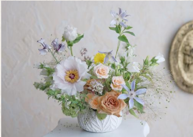
FA2001 闊口花砵 - 劍山應用