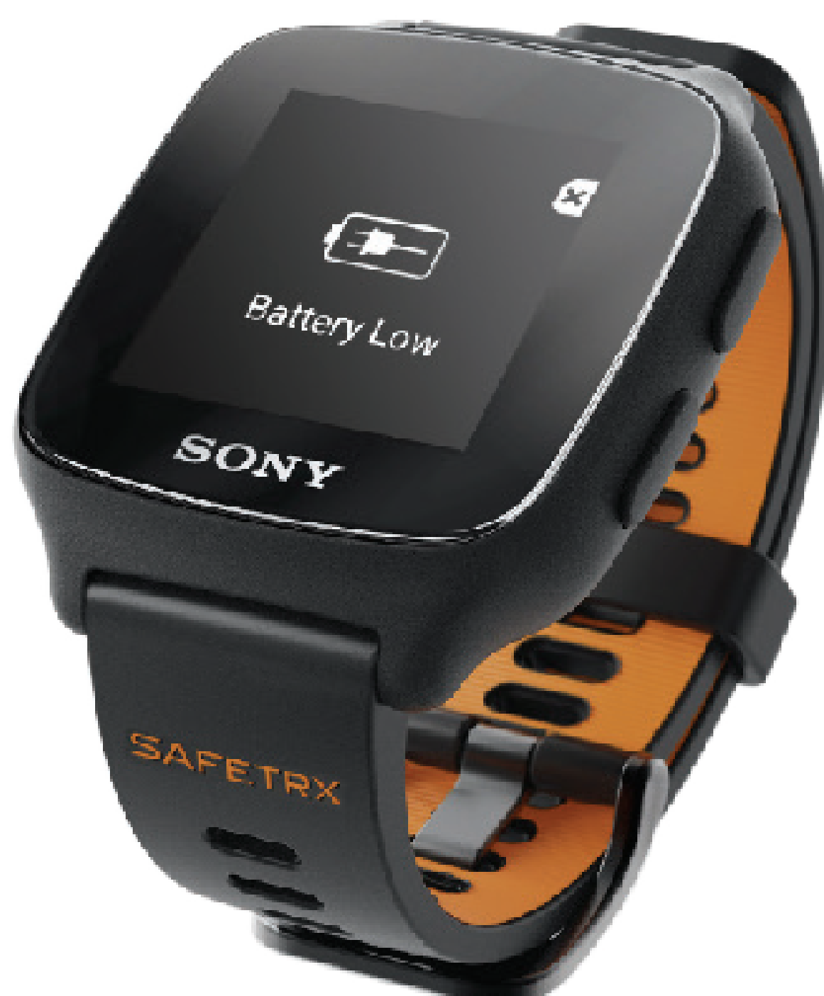
Alerte de batterie

Si la batterie est très faible, il est possible qu'une alerte ne soit pas en mesure de générer une actualisation de votre localisation en continu.