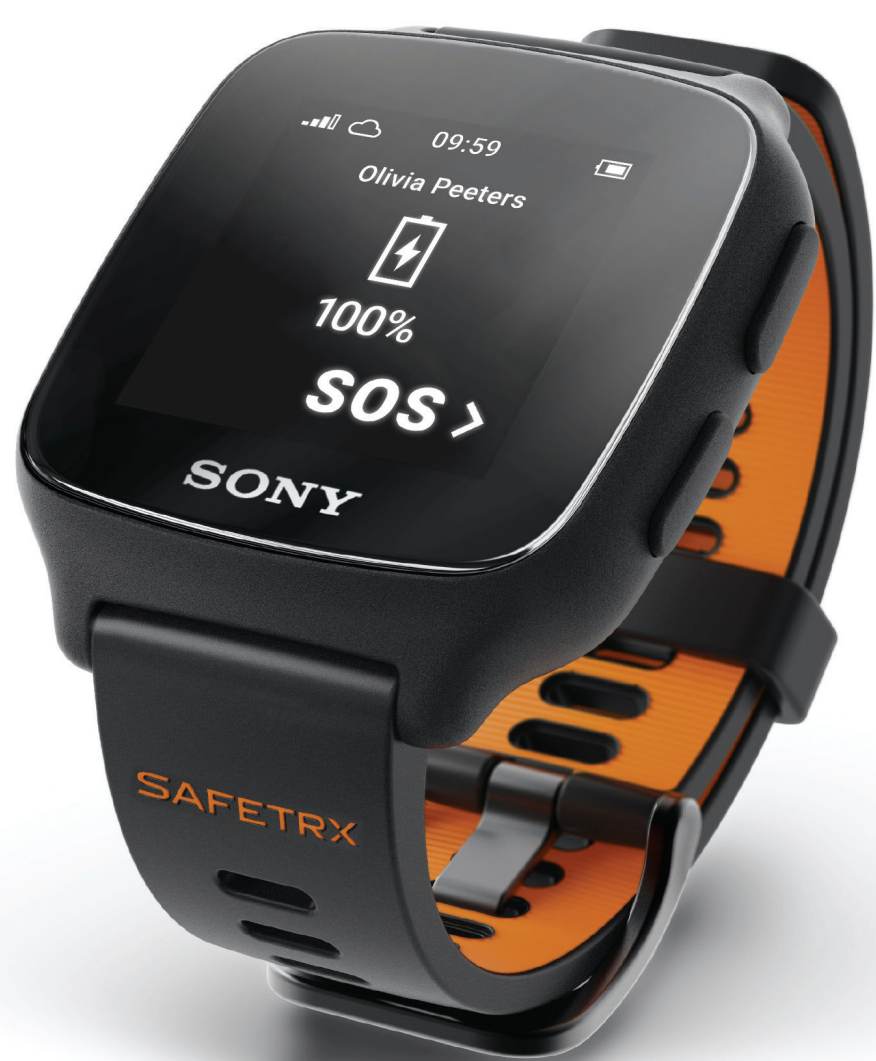
Écran de batterie

L'écran d'alerte s'affiche lorsque vous appuyez sur le bouton SOS pendant cinq secondes, ce qui envoie une alerte à vos aidants. Cet écran affiche l'alerte, la montre émet des bips et des vibrations, et le même bouton est désormais marqué « Stop ». Si vous appuyez à nouveau sur cette touche pendant cinq secondes, l'alerte est annulée et vous revenez à l'écran principal.