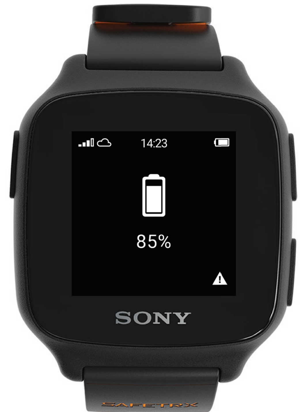
Niveau de charge de la batterie