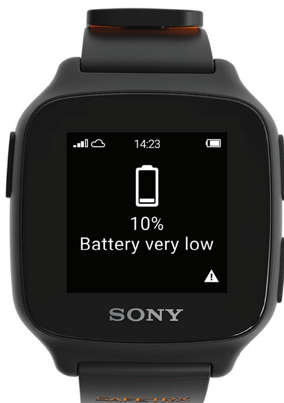
Alerte de batterie

Si la batterie est très faible, il est possible qu'une alerte ne soit pas en mesure de générer une actualisation de votre localisation en continu.