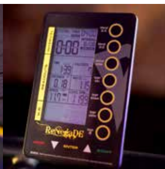
Groot LCD-scherm met 5 trainingsgegevens, waaronder snelheid, tijd, afstand, calorie en hartslag