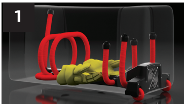
1 GANTS GLOVES

Each piece of equipment finds its place with the smart design of the DRYSNAKE bag. Remove garments before start drying. For drying, remove the fan flap completely and plug the power supply in making sure that the fan is not obstructed. The bag can be plugged all the time without problem. Unplug the power supply from the bag and close the flap to protect the fan when carrying. It is recommended to change the cartridges every month.