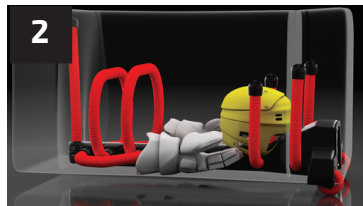
2 CASQUE HELMET