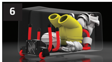
6 CULOTTE PANTS