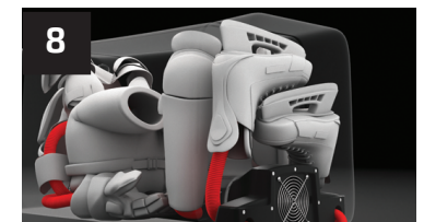
8 L'ÉQUIPEMENT PRÊT À SÉCHER EQUIPMENT READY TO DRY