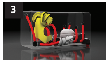
3 ÉPAULIÈRES SHOULDER PADS