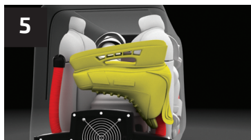
5 PATINS SKATES