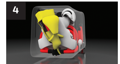
4 COUDES, PROTÈGE-COU ET COQUILLE ELBOW PADS, NECK GUARD AND JOCKSTRAP