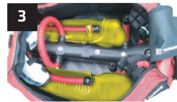
3 JAMBIÈRES SHIN GUARDS

Each piece of equipment finds its place with the smart design of the DRYSNAKE bag. Remove garments before start drying. For drying, remove the fan flap completely and plug the power supply in making sure that the fan is not obstructed. The bag can be plugged all the time without problem. Unplug the power supply from the bag and close the flap to protect the fan when carrying. It is recommended to change the cartridges every month.