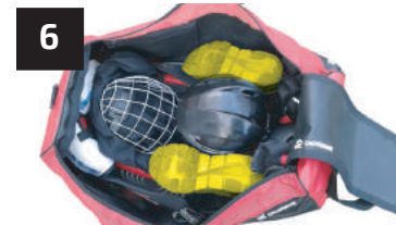
6 SOULIERS SHOES