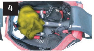
4 COUILLE-SHORT SHORTS-JOCKSTRAP