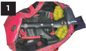
1 GANTS GLOVES

Chaque pièce d'équipement trouve sa place grâce au design ingénieux du sac DRYSNAKE. Retirez les vêtements pour les laver avant de commencer le séchage. Pour le séchage, dégager complètement le rabat du ventilateur et brancher le fil d'alimentation électrique en vous assurant que le ventilateur n'est pas obstrué. Le sac peut être branché en tout temps sans problème. Débrancher le fil du sac et fermer le rabat du ventilateur pour le transport. Changer les cartouches au mois.