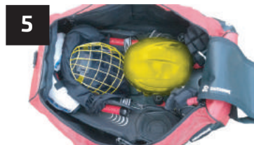
5 CASQUE HELMET