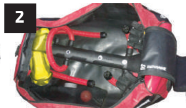
2 COUDES ELBOW PADS