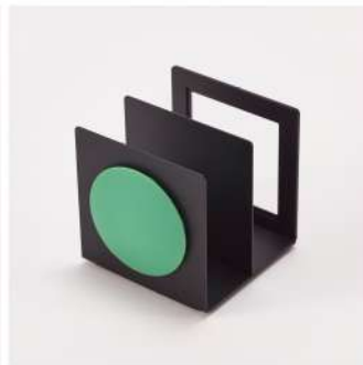
desk stand color: silver/black size:w85×h88×d92mm material: steel,silicon