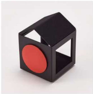
smartphone stand color: silver/black size:w85×h110×d92mm material: steel,silicon