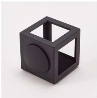
pen stand color: silver/black size:w85×h88×d92mm material: steel,silicon