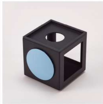
multi box color: silver/black size:w85×h88×d92mm material: steel,silicon