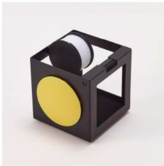
tape cutter storage color: silver/black size:w85×h100.5×d92mm material: steel,silicon ※テープは別売です。