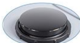
Capteur PIR intégré