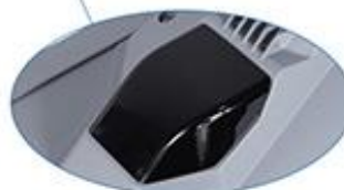
Couvercle en PC