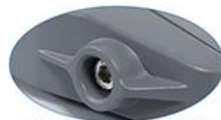
Vis en acier inoxydable pour renforcer le corps de la lampe