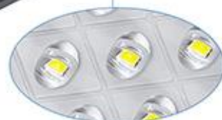
Lentille haute luminosité puce 5050