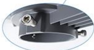
Bras droit intégré, installation renforcée