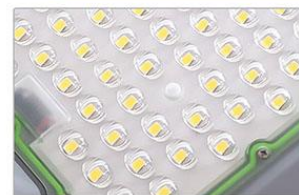
Puce LED Haute Luminosité