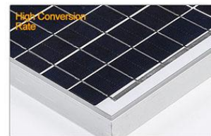
Panneau solaire monocristallin à haut rendement