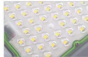
Puce LED Haute Luminosité