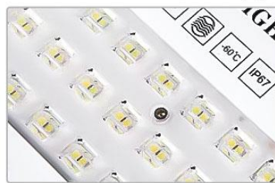
2 en 1 - Pucés LED 2835