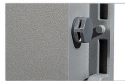
Trous d'aération pour éviter l'accumulation d'eau dans la lampe