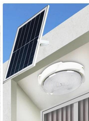
Chargement automatique durant la journée

Activez le mode de contrôle de la lumière, chargez automatiquement pendant la journée et éclairez automatiquement après la tombée de la nuit. Il n'est pas nécessaire d'allumer la lumière à la main.