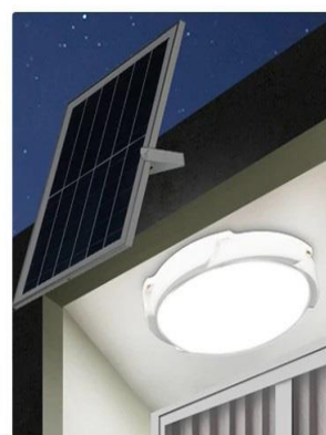
Éclairage automatique la nuit