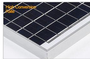
Panneau solaire monocristallin à haut rendement