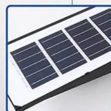
PANNEAU SOLAIRE POLYCRISTALLIN