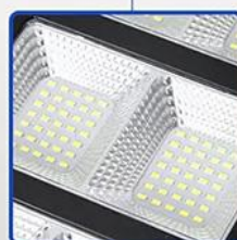
PUCE LED HAUTE LUMINOSITÉ