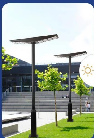
Chargement automatique durant la journée