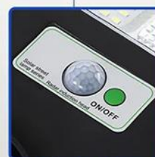
DÉTECTEUR DE MOUVEMENT