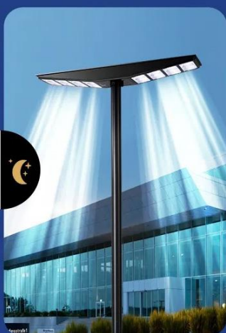
Éclairage automatique du crépuscule à l'aube