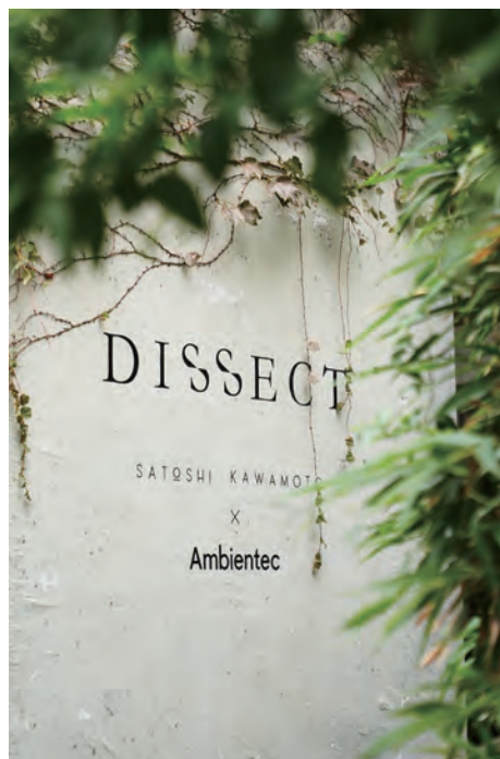
《DISSECT》展 / DESIGNART TOKYO 2022 @ LIGHT BOX STUDIO AOYAMA

The crystal glass is carefully cut by skilled craftsmen, Ambientec's unique double-sided LED developed for Xtal, and the domed mirrored metal reflector. The combination of these elements creates a dignified sparkle and radiant projection that leads to a special space.