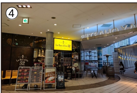
4. 3Fにある「ナチュラルローソン」と成城石井のレストラン「Le Bar a Vin 52 AZABU TOKYO」の間に、また歩道橋が見えてきます。