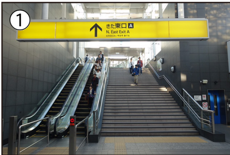
1. 横浜駅、東京方面先端のきた改札から「きた東口A」に向かいます。