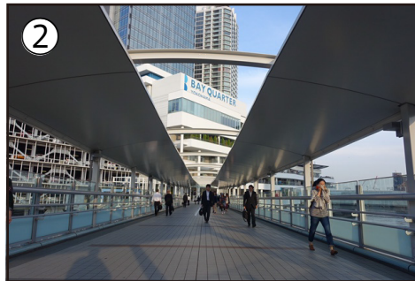
2. 歩行者専用道ベイクォーターウォークからベイクォーターへ向かいます。