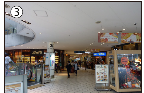
3. ベイクォーターの中心を通り抜けます。