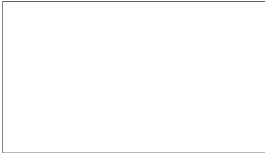
E White | Blanc | Weiß