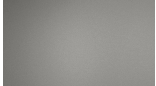
H17 Grey | Gris | Grau