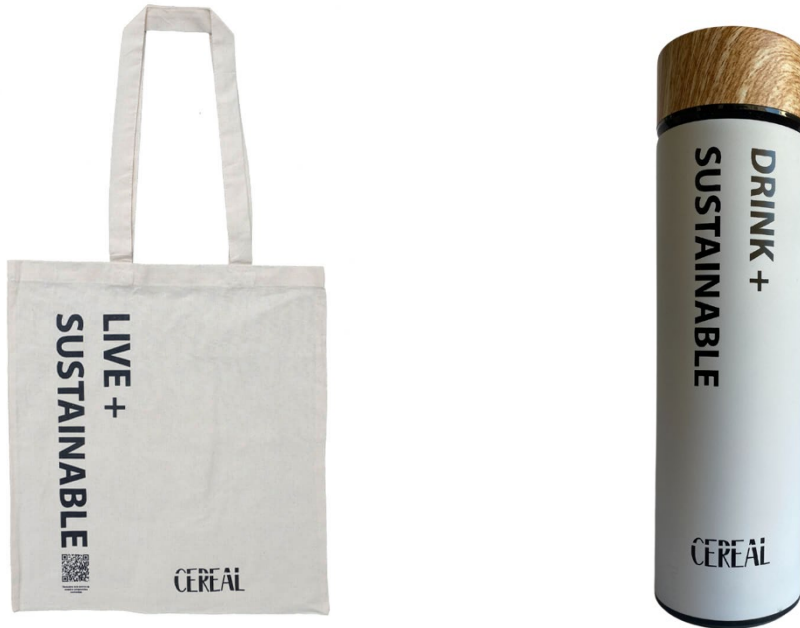
Imágenes de la bolsa de tela y botella reutilizables de Cereal Jewels