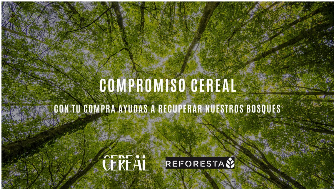
Imagen de la campaña de Cereal Jewels con la ONG Reforesta