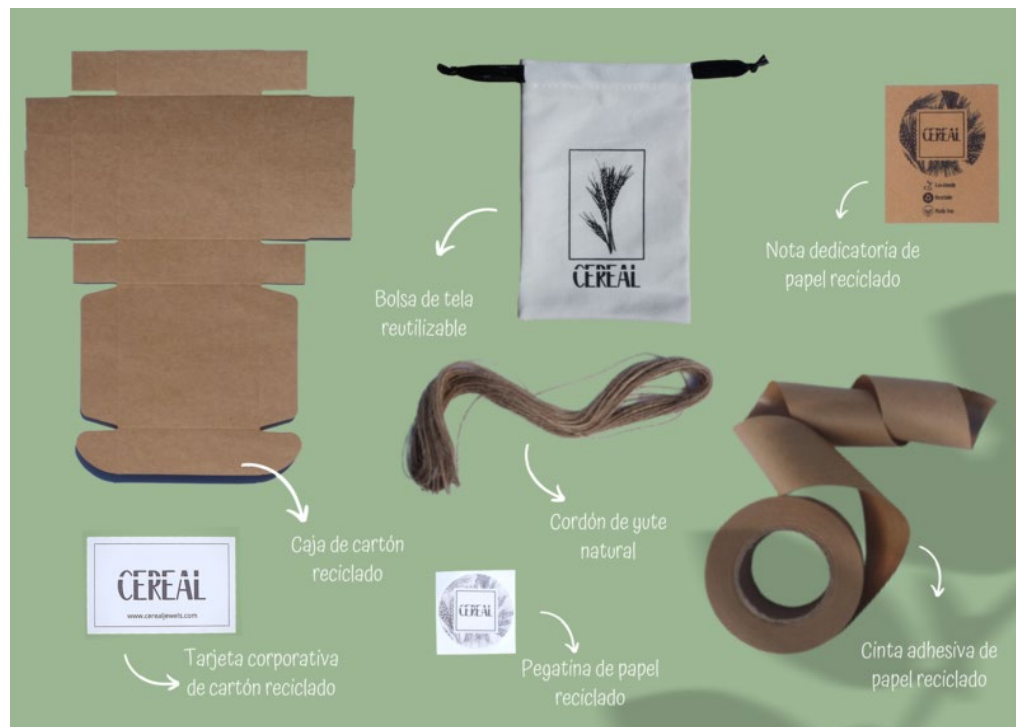
Imagen de nuestro packaging