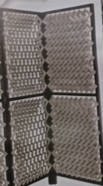
Sopra, paravento in pelle intrecciata diagonale e struttura in legno, PINETTI (1.840 € su ARTEMEST).

Curve, intagli, incastri, percorsi divergenti. Le linee guida degli accessori convergono sul dinamismo e sulle geometrie inaspettate.