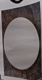
A destra, specchio Fideko, in legno curvato e lamina di metallo stampata, VISIONNAIRE.