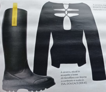
A sinistra, stivali in ecopelle a base di microfibra con tirante a contrasto e suola in EVA, DOUCALS (305 €).