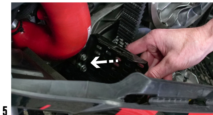
5 DÉVISSER ET ENLEVER LE SUPPORT DU PROTECTEUR SUPÉRIEUR DE L'EMBRAYAGE.