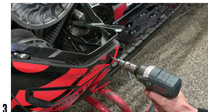
3 DÉVISSER LA VIS SUR LE CÔTÉ DE LA CARROSSERIE