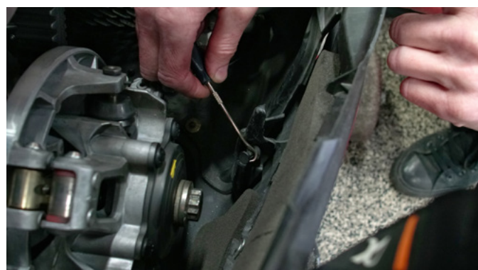
4 RETIRER LE GOUJON (PUSH PIN)