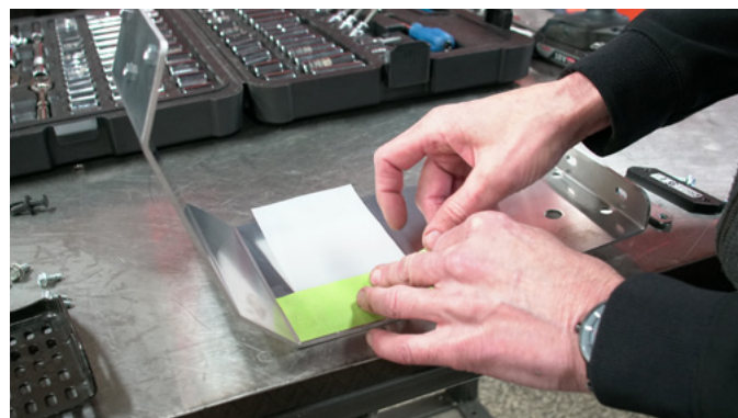
6 POUR FACILITER L'INSTALLATION ET PROTÉGER VOTRE NOUVELLE PIÈCE CONTRE LES ÉGRATIGNURES, COLLER LA FEUILLE DE TÉFLON FOURNIE SUR LA PAROI INTÉRIÈRE DE CELLE-CI À L'AIDE D'UN RUBAN DE TYPE MASKING TAPE. REPLIER UN COIN DU RUBAN SUR LUI MÊME POUR PERMETTRE DE LE DÉCOLLER PLUS FACILEMENT