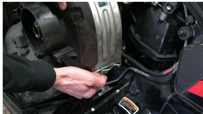
2 RETIRER LE PROTECTEUR SUPÉRIEUR DE L'EMBRAYAGE.