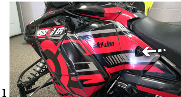
1 RETIRER LE COUVERCLE LATÉRAL GAUCHE