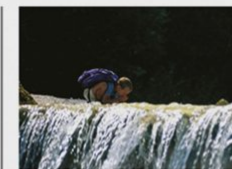
Zgoraj: Spodnji Martuljkov slap Martuljkova skupina

Vrnemo se po kolovozu, po katerem smo se vzpeli. Soteski se na sestopu izognemo tako, da sledimo kolovozu, ki nas pripelje do ceste.