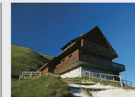
Koča na Golici

Rastlinam je v stebelcu pod cvetom ustvaril bunčico, ki je soku zaprla dohod v cvet, in tako čebelam preprečil pot do medu.